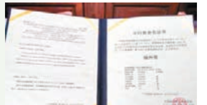
■國家天文台頒發《小行星命名證書》。本報福建傳真

國家天文台今年向國際天文學聯合會小天體命名委員會提交申請,將這顆小行星命名為「福州星」,並獲得了批准。