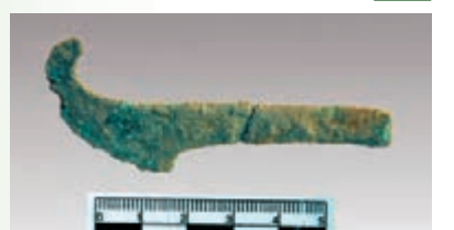
■出土的銅削刀。