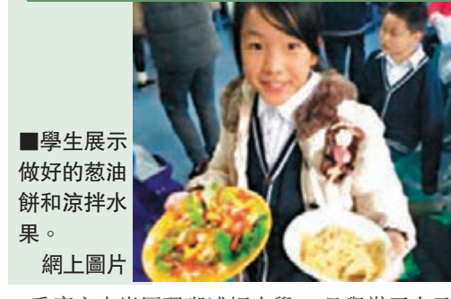
■學生展示做好的蔥油餅和涼拌水果。網上圖片

的孩子瞬間坐不住了,紛紛呼喊起這幾個人名。而視頻另外一端的小夥伴也開始躁動起來,衝到鏡頭前打招呼。原來,視頻另一端的小朋友是泰國南邦三倉學校的學生。