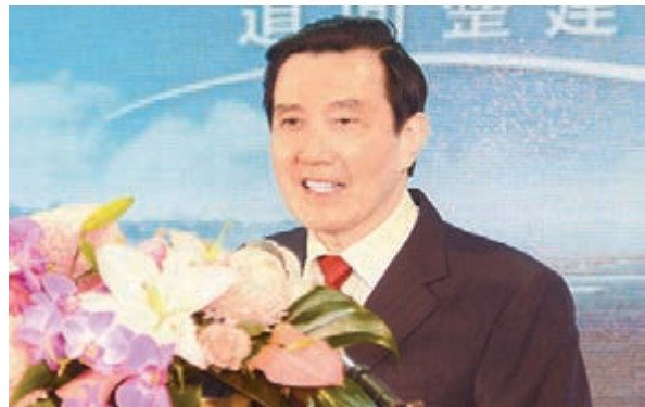
▲馬英九日前接受台媒專訪時首度公開表示,卸任後不排除訪問大陸。

香港文匯報訊 台灣地區領導人馬英九日前接受台媒專訪,面對台灣執政黨在「2016大選」後可能輪替,他憂心任內兩岸關係成果可能得而復失。馬英九還首度公開談到,卸任後不排除訪問大陸。