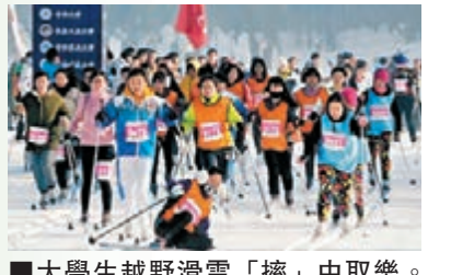
■大學生越野滑雪「摔」中取樂。

「藉着北京、張家口成功申辦2022年冬奧會的契機,舉辦大學生越野滑雪賽不僅能提升他們的健身效果,還有助於調動參與熱情」。中國大學生體育協會冰雪運動分會副秘書長王海東說。