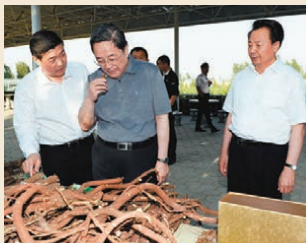
2014年，中共中央政治局常委、全國政協主席俞正聲考察億利資源庫布其沙漠生態建設情況。

在巴黎氣候大會期間，北京曾遭遇了兩次堪稱史上最嚴重的霧霾。對此，王文彪認為，治理霧霾除了加強減排，也要在「增綠」上做文章。作為全國政協常委的他，也多次就荒漠化防治、環境保護、霧霾治理等問題遞交提案。