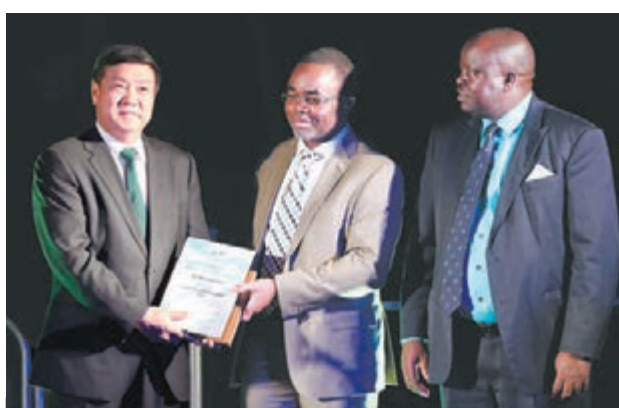
2013年9月，王文彪榮獲聯合國頒發的首屆「全球治沙領導者獎」。

從未到過沙漠的人們或許不會理解，那種孤島般的生活：走過的路，隔夜便不見蹤影；行走的坐標只有蒼茫中的那一輪紅日，而途中偶遇的一蓬植物就是打尖的驛站；駱駝往返最近的鎮子，6天已是天祐。王文彪向記者展示了27年前的庫布其照片，每一張都是乾涸龜裂、遍佈斷樹殘根的土地，不見天際的漫漫黃沙中隱現零星土房。