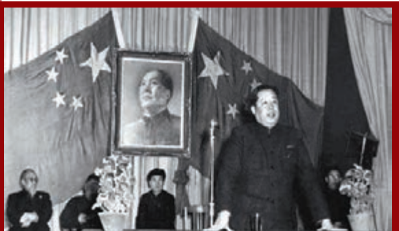
中國人民第一屆赴朝慰問團團長廖承志出發前在組團會上講話。