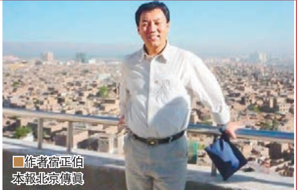
作者宿正伯 本報北京傳真