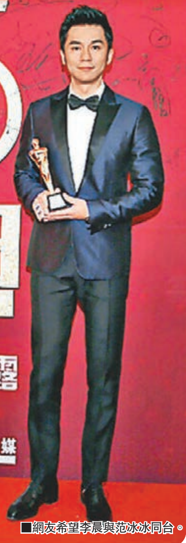
網友希望李晨與范冰冰同台。

范冰冰及李晨確認出席《國劇盛典》，兩人合作的《武媚娘傳奇》創下收視傳奇。劇中「牧哥哥」和「如意」朦朧美好的情感令人動容，而現實中的兩人更是羨煞旁人的神仙眷侶。由於李晨今年還有《三個奶爸》、《秀才遇到兵》、《天使的城》等劇，會否與范冰冰同台一時成謎。而網友已忍不住大呼：「求合體！」每年《國劇盛典》的海外嘉賓都頗受關注，這次節目組邀請到了韓國人氣爆棚的男神池昌旭。這位影視歌三棲男神將帶來怎樣的表演，也是這次《國劇盛典》最大的看點之一。