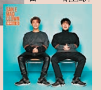
■San E早前跟Mad Clown合作出新歌。

要踏上舞台，即可盡情rap出自己的想法。以前移民去美國時，因為英文不叻，就算有話想說，也只能憋在心裡，因此更被Hip Hop吸引，想到可盡情說出自己的想法，就覺得很爽！」