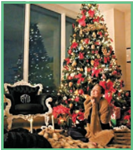
■濱崎步於Instagram上載首張照片。網上圖片