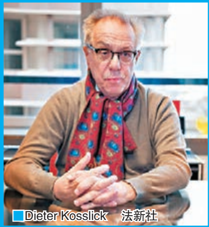
■Dieter Kosslick