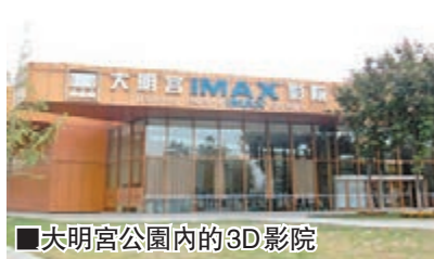
■大明宮公園內的3D影院

參觀大明宮國家遺址公園一定要欣賞IMAX 3D電影《大明宮傳奇》；影片是中國首部IMAX 3D電影，2010年10月1日大明宮國家遺址公園正式開園，該片也於同日公映。由金鐵木執導，邀請了荷里活技術團隊使用3D特效技術生動再現了中國歷史上唐朝的繁榮昌盛景象。看完《大明宮傳奇》無不對大明宮的荒廢感到非常可惜，如果保留至今一定不會比故宮遜色。 ■鳴謝香港中國旅行社