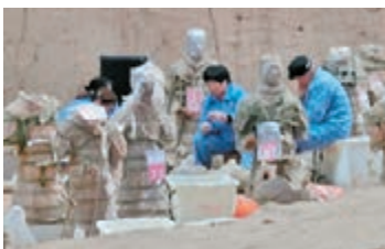
■修復兵馬俑需要很大工程哩。