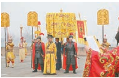
■冬至當天大明宮公園內重現唐代冬至日祭天禮