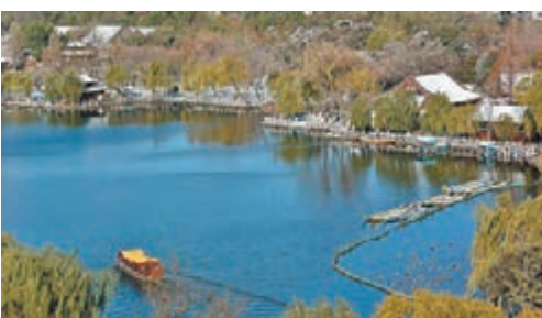
大明湖風光美如畫 雪過天晴的濟南大明湖景區風光。