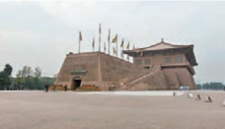
■丹鳳門遺址博物館；殿前東西兩側有翔鸞、棲鳳二閣和通往平地的龍尾道。其位置在大明宮北部太液池之西的高地上，是皇帝召見貴族親信、接見外國使臣和舉行盛大宴會的地方。

大明宮正門名丹鳳門，正殿為含元殿。含元殿以北有宣政殿，宣政殿左右有中書、門下二省，及弘文、弘史二館。此外，有別殿、亭、觀等30多所。含元殿是當時唐長安城內最宏偉的建築。自唐高宗