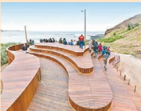
■非利普島自然公園

同時，聖誕樹於這個佳節中必不可少，10米高的LEGO聖誕樹已經聳立在聯邦廣場，由建築大師Chris Steininger親自設計和建築的巨型LEGO聖誕樹由逾50萬塊LEGO積木砌成。這棵聖誕樹專為澳洲LEGO迷而設計，當中融入了地道元素如正在揮動板球球棒的小精靈、搗蛋的笑翠鳥和準備去滑雪的聖誕老人等。