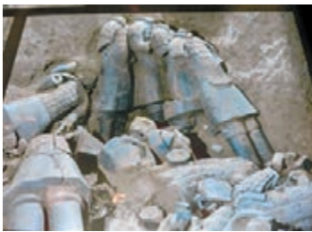
■西安兵馬俑第二號坑開發出土的情況。