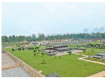
■遺址一角建造了一片唐代大明宮盛世時期建築物模型