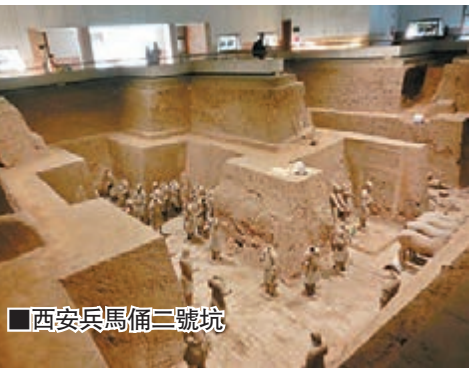
■西安兵馬俑二號坑

1.5公里，處臨潼區西楊村南，已發現一號兵馬俑坑內約埋藏陶俑、陶馬6,000件，還有大量的青銅兵器。二號俑坑的平面呈曲尺形，從試掘的情況推斷，二號兵馬俑坑內埋藏陶俑、陶馬1,300餘件。二號俑坑較一號俑坑的內容更豐富，兵種更齊全，是兵馬俑坑中的精華。三號兵馬俑坑平面呈「凹」字形，坑內埋藏陶俑、陶馬。有學者認為它是統帥一、二號兵馬俑坑的指揮部，古代稱為軍幕。