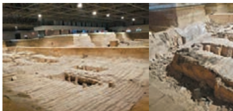
■三號坑道的陶俑碎片貼上白色的字條碼以便重組。