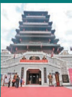
■中興閣內有不少文物展覽。

進入霸城溢彩片區，遊人肯定不能錯過的漢城牆遺址，在西漢的長安城是中國歷史上第一個規模最大的城市，距今已有2,000多年的歷史。你會覺得漢城牆遺址古旗飄揚，加上穿着漢服的導遊極配。位於角樓疊翠片區的中興閣，是漢城湖景區的標誌性建築，建築高度為53.6米，地下兩層，地上七層，是漢城湖水利風景區的制高點。人們登高遠眺，景區美景及漢長安城遺址盡收眼底。