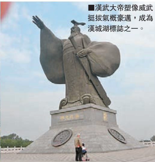
■漢武帝塑像威武挺拔氣概豪邁，成為漢城湖標誌之一。