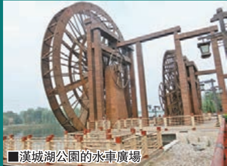
■漢城湖公園的水車廣場