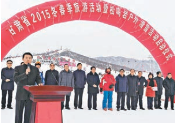
■甘肅省2015冬春季旅遊活動暨松鳴岩戶外滑雪活動啟動儀式在和政縣隆重舉行。

香港文匯報訊（記者 王岳、李燕華 臨夏報道）甘肅省「2015冬春季旅遊活動暨松鳴岩戶外滑雪活動」日前在臨夏和政縣啟動，該活動項目將推出比基尼滑雪表演、單板滑雪表演、雪地摩托車表演、萬人打雪仗、夜間滑雪、冰雕雪雕夜景觀賞，以及篝火晚會、文藝表演等活動，使冬春冰雪旅遊成為一張讓外界了解甘肅的名片。