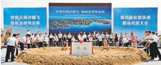
■南沙明珠灣起步區建設全面鋪開。