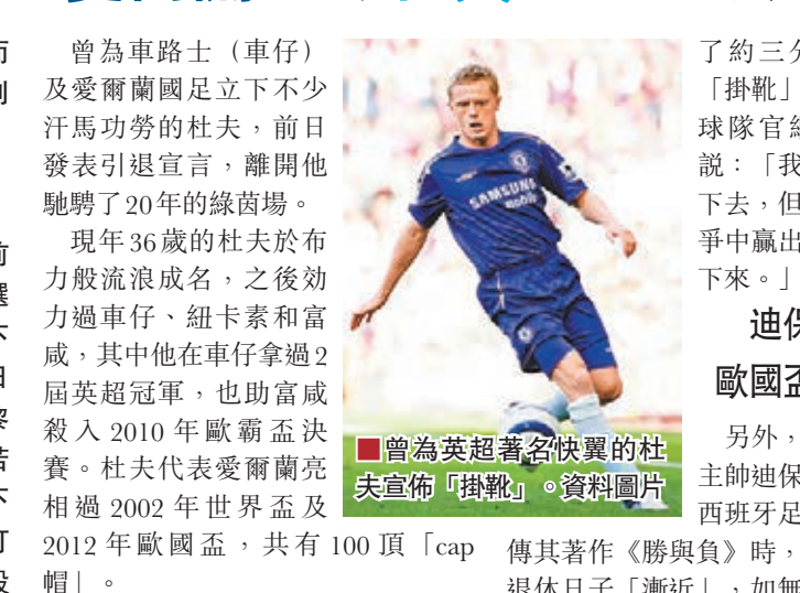
曾為英超著名快翼的杜夫宣佈「掛靴」。資料圖片

曾為車路士(車仔)及愛爾蘭國足立下不少汗馬功勞的杜夫，前日發表引退宣言，離開他馳騁了20年的綠茵場。現年36歲的杜夫於布力般流浪成名，之後效力過車仔、紐卡素和富咸，其中他在車仔拿過2屆英超冠軍，也助富咸殺入2010年歐霸盃決賽。杜夫代表愛爾蘭亮相過2002年世界盃及2012年歐國盃，共有100頂「cap帽」。