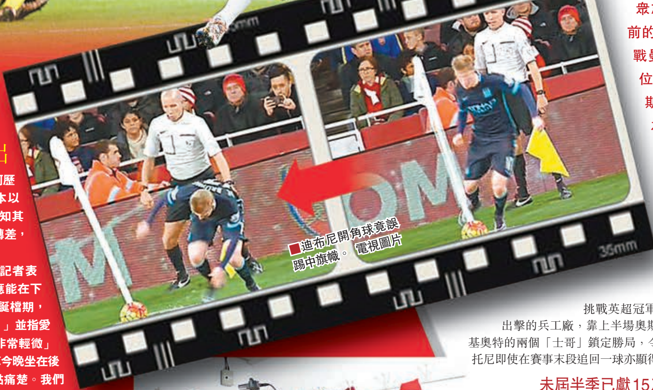
迪布尼開角球竟誤踢中旗幟。電視圖片