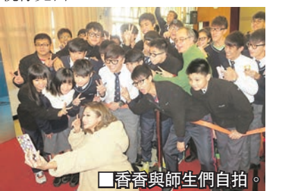
香香與師生們自拍。

香港香正忙於拍攝新劇《江湖大佬》,故此聖誕節會約同劇中演員一起度過,屆時會在廠開派對。今年是她拍拖後的首個聖誕,惟未能跟男友慶祝,屆時可能透過視像見面。