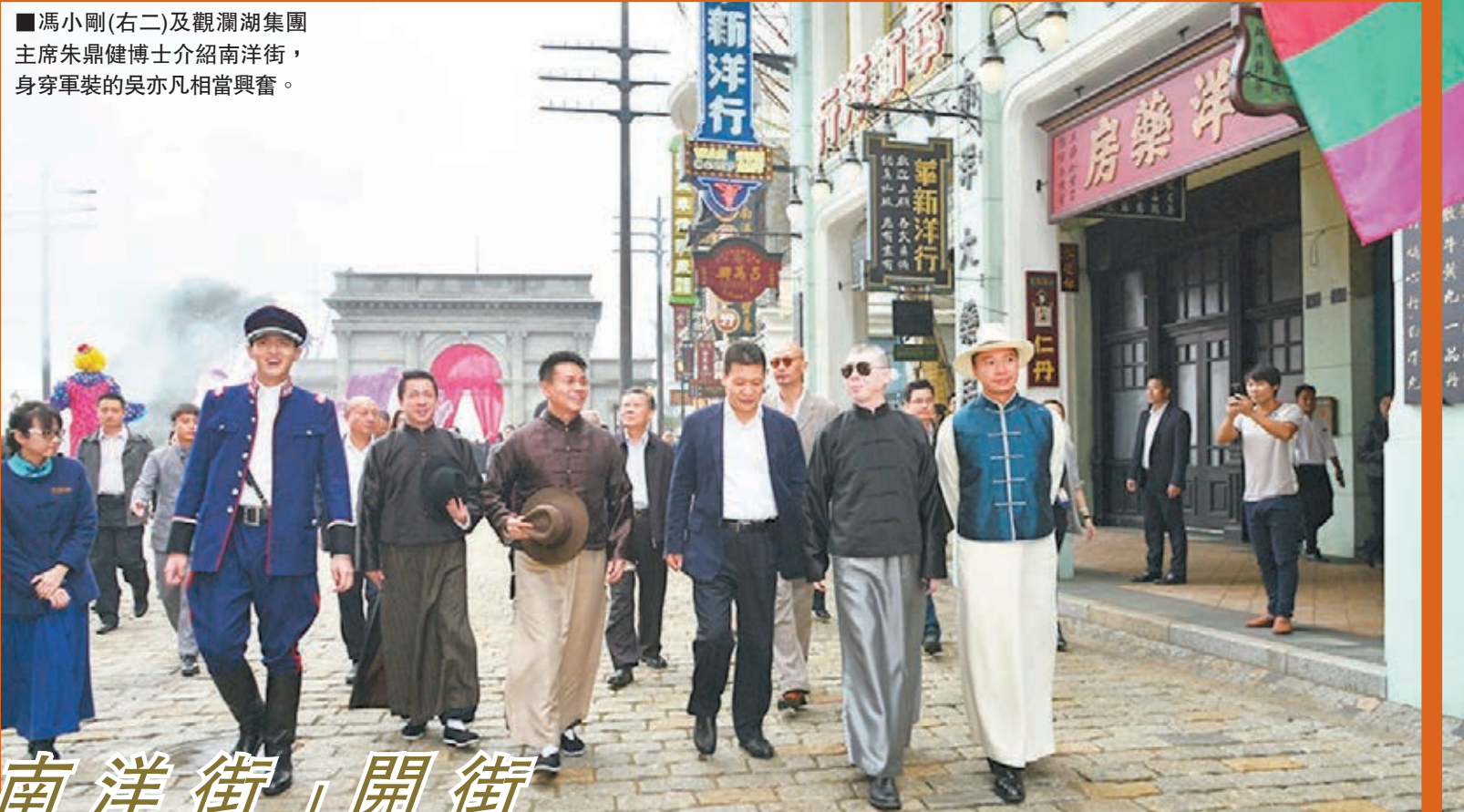
馮小剛(右二)及觀瀾湖集團主席朱鼎健博士介紹南洋街,身穿軍裝的吳亦凡相當興奮。

香港文匯報訊(記者何致、安莉海口報道)昨日上午,海口觀瀾湖華誼「馮小剛電影公社」「南洋街」正式對外開放,電影《老炮兒》的主演金馬影帝馮小剛、導演管虎、演員吳亦凡等身穿時代服裝,乘坐馬車緩緩入場,助陣開街儀式。受訪時,馮小剛對新人演員吳亦凡讚不絕口,認為對方是個非常有想法的演員,希望將來有機會再跟他合作。