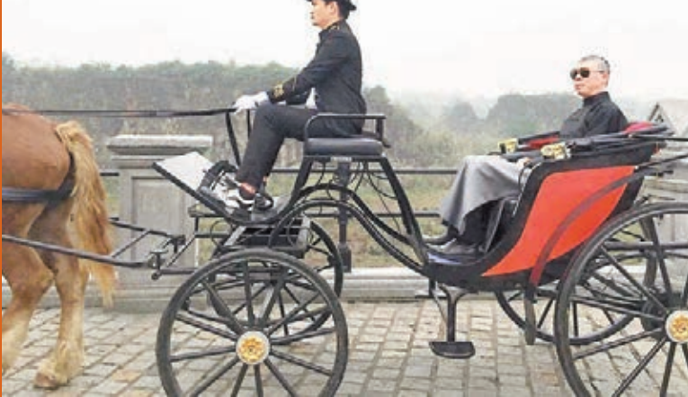
馮小剛乘坐馬車入場。

香港文匯報訊(記者何致、安莉海口報道)昨日上午,海口觀瀾湖華誼「馮小剛電影公社」「南洋街」正式對外開放,電影《老炮兒》的主演金馬影帝馮小剛、導演管虎、演員吳亦凡等身穿時代服裝,乘坐馬車緩緩入場,助陣開街儀式。受訪時,馮小剛對新人演員吳亦凡讚不絕口,認為對方是個非常有想法的演員,希望將來有機會再跟他合作。