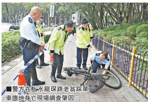
警方在止水龍琛路老翁踩單車墮地身亡現場調查肇因。

事發昨清晨7時許，黃翁踏單車途經天平路近龍琛路時，突然「自炒」連人帶車翻倒地昏迷，救護員接報趕至將其送院搶救，惜證實不治。案件現交由新界北總區交通部特別調查隊跟進，正調查老翁是否因病出事。警方呼籲任何人如目睹該宗意外發生或有資料提供，請致電3661 3800與調查人員聯絡。