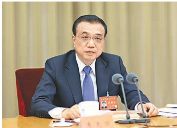
■李克強在會議上論述當前城市工作的重點。