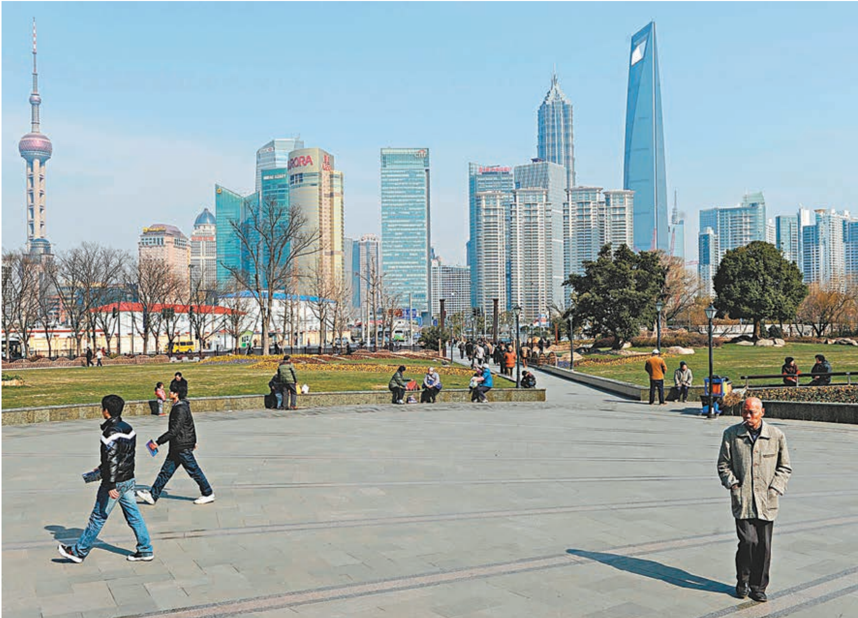
■中央城市工作會議強調，抓城市工作，一定要抓住城市管理和服務這個重點。圖為上海市。