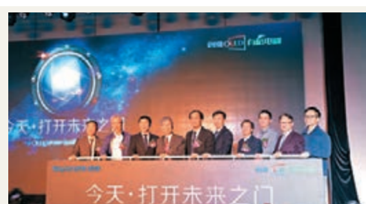
創維昨日推OLED有機電視S9。

恒生銀行昨宣佈，委任現年59歲的陳國威為該行大中華業務主管，將會向該行副董事長兼行政總裁李慧敏匯報，並專注於恒生銀行之中國內地及跨境業務發