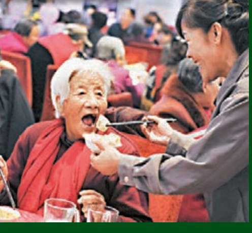
冬至前夕，甘肅省蘭州市「人人為老」養老服務中心昨日組織千名志願者為蘭州「空巢老人」現場包餃子並與老人暖心暢聊。同時，他們還組織了30支志願者隊伍為1,000戶空巢老人送去了愛心餃子。