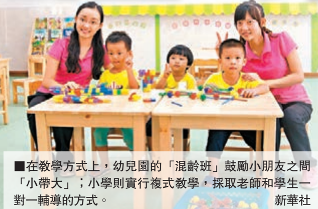
在教學方式上，幼兒園的「混齡班」鼓勵小朋友之間「小帶大」；小學則實行複式教學，採取老師和學生一對一輔導的方式。

12月14日三沙市政府發佈消息稱，三沙市永興學校正式投入使用，教學工作正有序進行。經過18個月的努力，三沙結束了沒有學校的歷史。