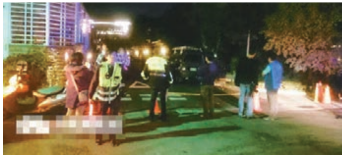
警方仍在等待民宅內的情況。