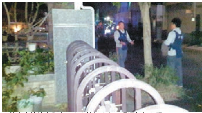
警方在挾持大學生民宅處等候消息，現場氣氛緊張。

台東市長張國洲昨日夜間9點趕到場靜候與對方談判，希望先救出人質，不要傷害無辜。張國洲表示，如果警方願讓他對談，知道對方的要求，做得到的話就不要傷害無辜，希望人質先救出來。警方表示，三名遭挾持的人質都是台東大學學生，在21時33分其中2名獲釋到一樓，疑犯仍與1名人質在三樓持續溝通中。截至凌晨12時半，有關台東發生通緝犯劫持人質事件，「警政署長」聲明中表示，如果有任何委屈，可向在場檢察官訴求。