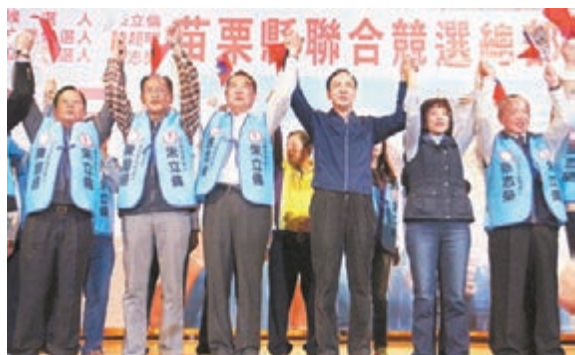
「大選」候選人朱立倫(右3)、副候選人王如玄(右2)及「立委」參選人陳超明(左2)、徐志榮(左3)等人高喊凍蒜(當選)。

香港文匯報訊 中國國民黨「2016大選」候選人朱立倫昨日(21日)在苗栗競選總部成立大會上表示，台灣不能走回頭路，未來的台灣一定要開放，唯有兩岸和平安定才能好好拚經濟，「拚經濟的成果要讓全民共享」。