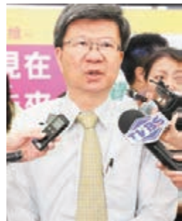
台灣「教育部長」吳思華表示尊重專家意見。

香港文匯報訊 台灣高中歷史課綱微調內容引發不少爭議，「教育部」課綱專家諮詢小組日前討論高中歷史課綱爭議，小組成員林滿紅昨日表示初步達成共識，已經釐清16項，明年還會再召開會議並公佈結果。