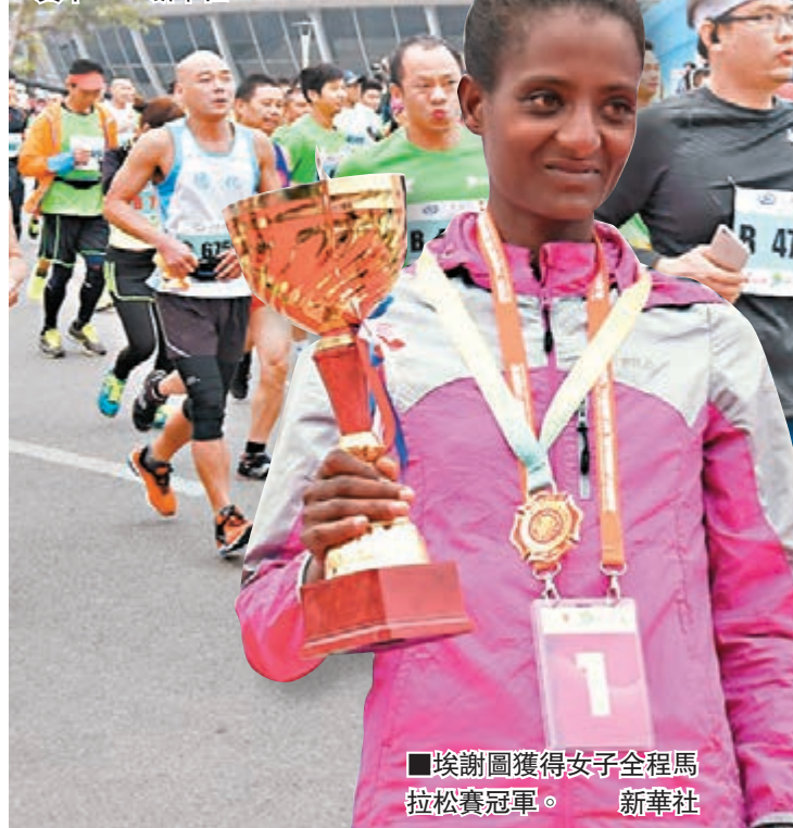
參賽選手在比賽中。

據介紹,今年以來,第一屆全國青年運動會、世界沙灘排球巡迴賽、中華龍舟大賽、中國羽毛球公開賽、環福州永泰國際公路自行車賽等各大賽事先後在福州舉辦,推動了當地全民健身以及體育產業的發展。福建省體育局局長徐正國稱,首屆福州國際馬拉松賽從籌辦之初就堅持高標準、高要求,力爭打造成中國田協銅牌賽事。