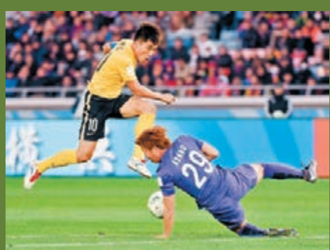
恒大戰將(左)整年在場上努力比賽。

與廣島三箭的對決,是恒大2015年的最後一場比賽,恒大未能用一場勝利為全年的比賽收官,值得一提的是,這也是恒大2015年第二次遭遇連敗的狀況,同時,這也是主帥史高拉利執掌