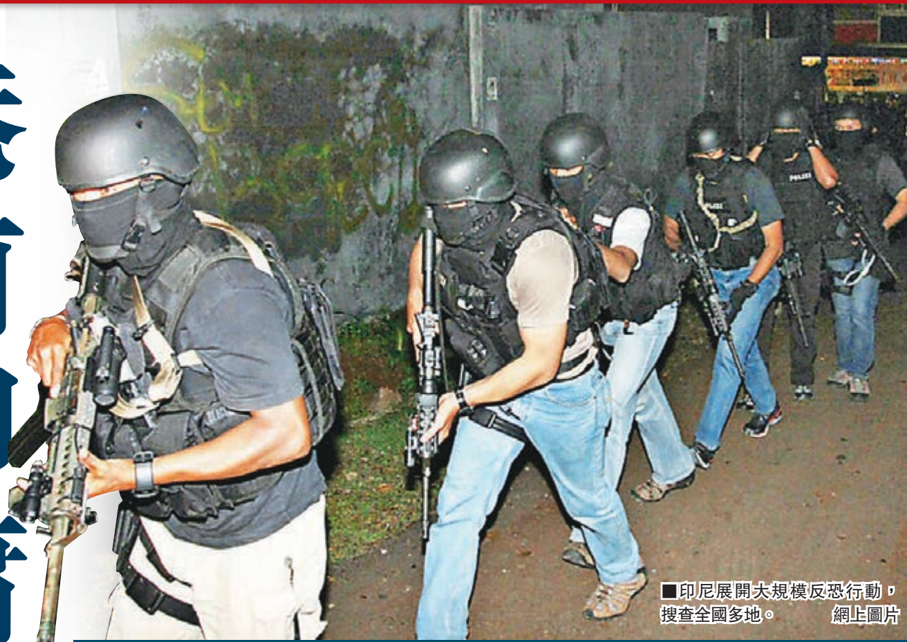
■印尼展開大規模反恐行動，搜查全國多地。 網上圖片