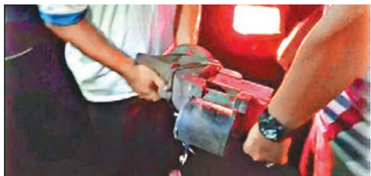
■印尼當局在疑犯住所搜出炸彈材料等物品。

印尼警察總長巴德羅昨日指，當局根據美國聯邦調查局(FBI)及澳洲聯邦警察的情報，於上周五展開行動。