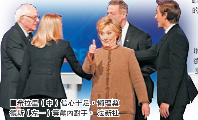
■希拉里(中)信心十足，懶理桑德斯(左一)等黨內對手。

今次辯論舉行前夕，桑德斯競選陣營被揭偷取希拉里陣營的機密資料，掀起軒然大波。桑德斯在辯論開始不久，就事件向希拉里道歉，對方表示接受，形容「這不是美國人有興趣的事」。這令人回想起10月首場電視辯論時，桑德斯為深陷「電郵門」醜聞的希拉里解圍，希拉里今次可謂投桃報李。 ■《華爾街日報》/法新社/路透社/美聯社