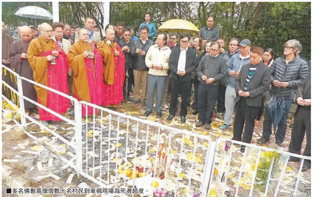
多名佛教高僧數十名村民到車禍現場為死者超度。