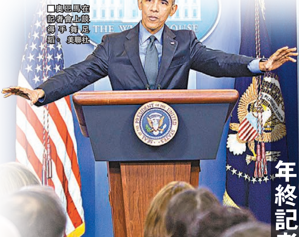
□奧巴馬在記者會上談得字舞足蹈。美聯社

反對派批停火目標脫離現實 獲西方支持的敘利亞主要反對派「敘利亞全國聯盟」(SNC)則對下月初停火不樂觀，認為這目標脫離現實，稱反對派需要至少一個月才能準備參與談判，並要求俄羅斯停止空襲作為停火條件之一。 ■法新社/路透社/美聯社