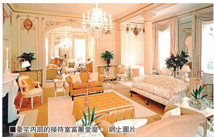
■豪宅內部的接待室富麗堂皇。 網上圖片

王健林在福布斯最具影響力和最富裕人士排行榜中都佔有相當的地位。據估計，他的資產數額超過了200億英鎊(約合港幣2,309億元)。