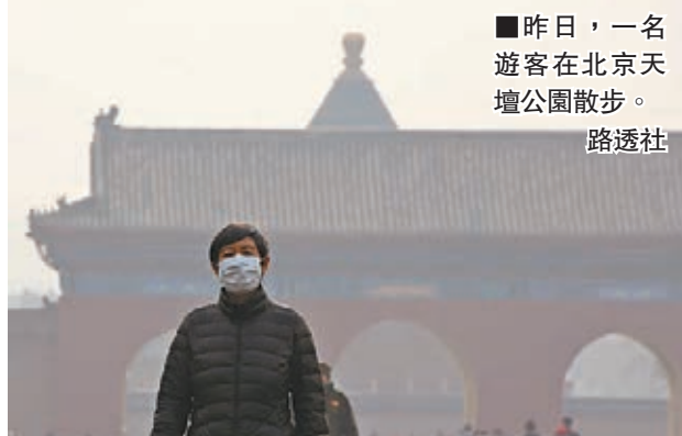
■昨日，一名遊客在北京天壇公園散步。

一是要增強綠色發展的定力，守住生態環保的紅線，實現經濟發展和環境保護共贏；二是加大環境治理力度，堅持以改善環境質量為核心，推動多污染物的聯合防治，實行聯防聯控；三是加快工業綠色化升級，努力改變「產業結構偏重，能源結構偏黑」的局面，加快培育節能環保市