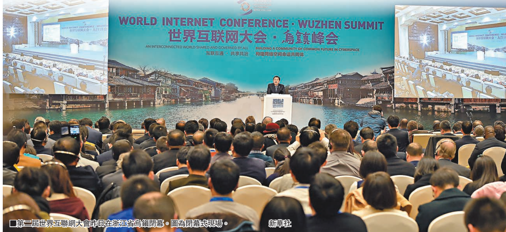
第二屆世界互聯網大會昨日在浙江省烏鎮開幕。圖為開幕式現場。

世界互聯網大會組委會秘書處設立高諮委,旨在邀請中外互聯網領軍人物為世界互聯網大會的舉辦出謀劃策,為中國互聯網的發展獻計獻策。其主要職責包括匯總統理大會各方意見建議,為大會組委會秘書處提供諮詢。