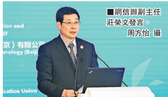
網信辦副主任莊榮文發言。

據悉,寧波是外貿大市,90%的外貿企業利用互聯網開拓業務。寧波的跨境電商交易額位居內地試點城市前茅,寧波正全力打造「國際電子商務中心城市」。並借助世界第一大港寧波舟山港的優勢,實現智能訂倉、智慧供應鏈等服務功能。同時,建立了內地首家「雲醫院」,讓居民「足不出戶看雲醫、不出社區看名醫」。最近,寧波獲得了中國最具幸福感城市第二名。