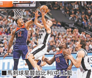
馬刺球星贊奴比利(中)上籃。