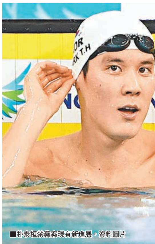
朴泰桓禁藥案現有新進展。資料圖片

韓國金牌泳手朴泰桓的禁藥風波，昨日出現突破性發展。當地傳媒指為朴注射藥物而令其藥檢「肥佬」的46歲金姓女醫生，昨日獲首爾中央地方法院發表終審結果，就是她違反了醫療法，需罰款100萬韓圓(約6,600港元)，但另一罪名「業務過失使運動員身體受到傷害」則不成立，為朴泰桓明年代表韓國參加里約熱內盧奧運(里奧)重現曙光。