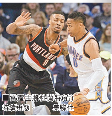
雷霆主將杜蘭特(右)持續勇戰。

勇士今場的三分球成功率接近5成，反觀「炒粉」甚多的太陽則只有22.7%，和兩隊得分相吻合。另外，因病而出出許多的勇士教練卡爾，今週已計劃開始增加工作量，希望能在球隊的連續5場主場比賽中幫手。