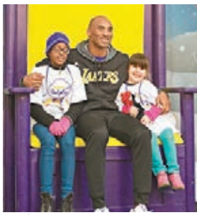
高比夥湖人隊友行善。

正享受其最後一季賽事的高比，周三趁沒有比賽借湖人隊友行善，於名為「小孩子的湖聖誕派對」跟小朋友見面，高比更和小球迷合照留念，樂在其中。對於NBA總裁蕭華指高比絕對值得成為本賽季全明星賽的其中一員，高比坦言即使最終落選仍不會太失望：「無論怎樣我都會支持這比賽，支持參與的球員。」