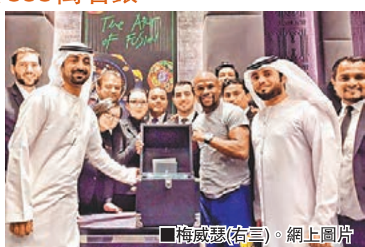
梅威瑟(右三)。

已引退的美國「不敗拳王」梅威瑟，未因再沒有拳賽「搵銀」而停止其揮霍生活。近日梅威瑟現身中東，斥資110萬美元(約858萬港元)買下一隻鑽石錶，更和店員合照。雖然買東西時從容不迫，事實上他在今年5月對菲律賓拳王帕奎奧的「世紀之戰」已鯨吞了1.8億美元(約14億港元)，相比起來買錶錢真的如同「散紙」呢。 ■記者 鄭御龍