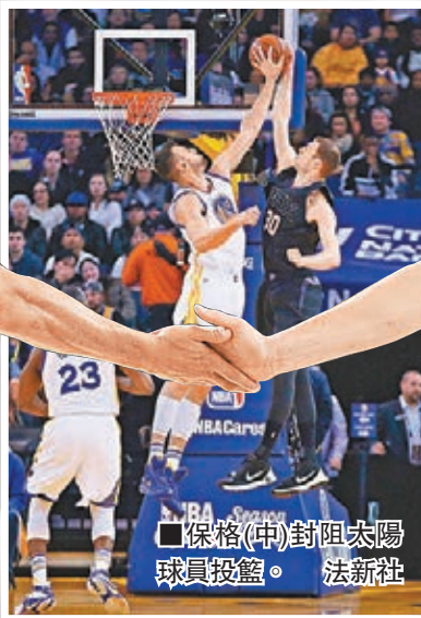
保格(中)封阻太陽球員投籃。