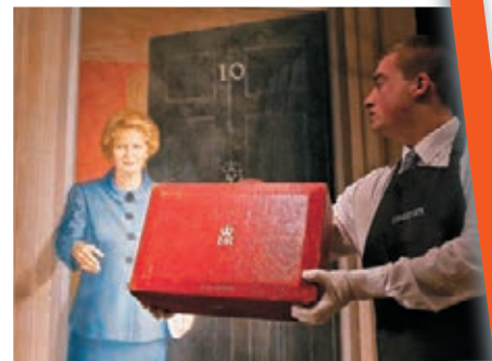
「鐵娘子」首相紅箱以約283萬港元成交。■美聯社

只有約50萬英鎊(約583萬港元)，但僅拍賣場成交額已逾328萬英鎊(約3,823萬港元)。■《每日郵報》/《泰晤士報》/《衛報》