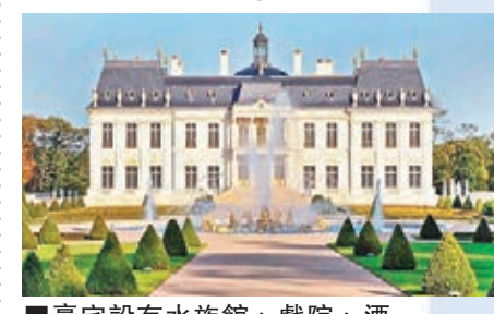
豪宅設有水族館、戲院、酒窖等。■美聯社

法國巴黎莊園「路易十四城堡」最近由一名來自中東的買家，以逾3億美元(約23.3億港元)買下，打破2011年倫敦一座大宅創下的2.21億美元(約17.1億港元)全球最貴豪宅成交紀錄。消息人士透露，今次交易由佳士得國際地產作為中介。發展商Cogemad及佳士得均拒絕置評。Cogemad網站顯示，大宅位於凡爾賽及馬爾利勒魯瓦之間一個23公頃的園林內，以3年時間建成，設有水族館、戲院、酒窖，花園仿照國王路易十四的宮殿設計，擺放了大理石雕像及建有一個以金箔裝飾的噴水池。 ■彭博通訊社/Cogemad網站