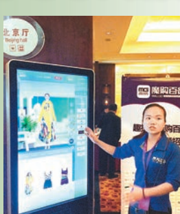
■顧客可站在移動電子百貨前進行真人試衣。

線下實體店鋪因電商發展近年遭受巨大衝擊，眾多企業紛紛謀求商業轉型。近日，一款名為「趣搭—魔購百貨」的體驗客戶端就赴廣西桂林進行入駐招商，該款客戶端與成年人身高相仿，利用3D技術，顧客可站在客戶端前選擇自己喜歡的品牌款式進行試衣穿搭，點擊即可購買。目前該款客戶端已在桂簽約四個代理商，不久將在當地各大商場放置使用。