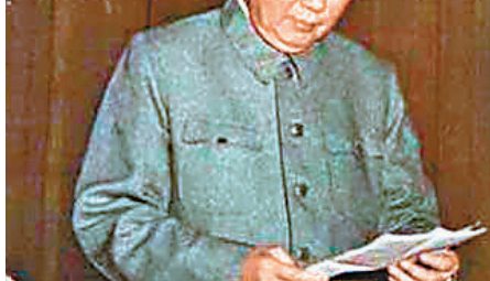
■毛澤東在看信件。

該信件內容是呼籲英國援助抗日，下款有毛澤東及時任中央革命軍事委員會副主席朱德的中英文簽名。寫信的時間是1937年11月1日。蘇富比指，信件由中