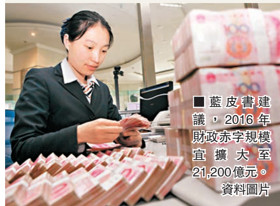
■藍皮書建議，2016年財政赤字規模宜擴大至21,200億元。 資料圖片

藍皮書建議，2016年財政赤字規模可擴大至21,200億元，比2015年增加5,000億元，財政赤字規模與國內生產總值比率仍可控制在3%以內。其中，中央財政赤字11,200億元，比2015年增加1,000億元，地方財政赤字10,000億元，比2015年顯著增加4,000億元。