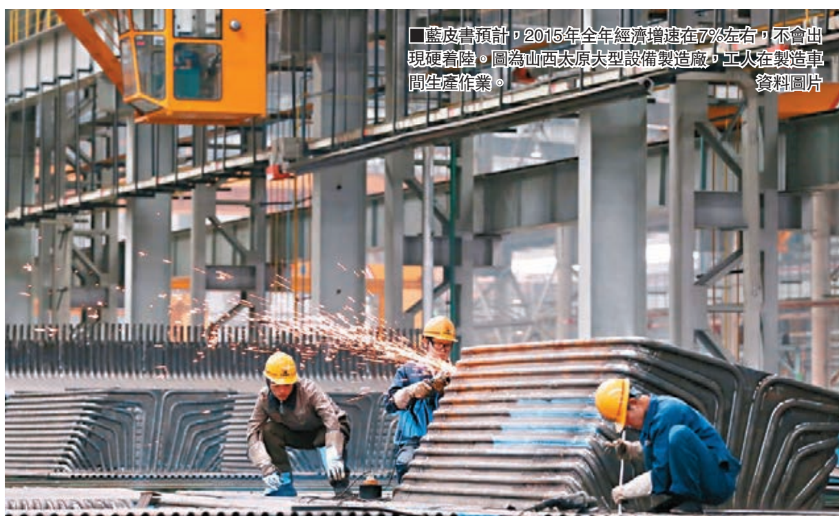
■藍皮書預計，2015年全年經濟增速在7%左右，不會出現硬著陸。圖為山西太原大型設備製造廠，工人在製造車間生產作業。

為應對經濟下行壓力加劇，藍皮書建議，2016年加大積極財政政策的實施力度十分必要，應把「穩增長、增效益」作為積極財政政策的重心，加大積極財政政策在積極擴大國內需求方面的直接作用。繼續實施結構寬鬆的貨幣政策，引導貨幣信貸及社會融資規模增長合理適度加速。推動有利於實體經濟發展和結構調整的金融改革，推進多層次資本市場發展，改善金融宏觀審慎風險管理，防範系統性金融風險。