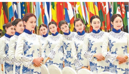
■禮儀小姐身穿青花瓷魚尾禮服。

走的中式風,既保暖又精神。「突出中國風和水鄉古鎮特色,凸顯傳統文化的魅力,讓全世界看到。」