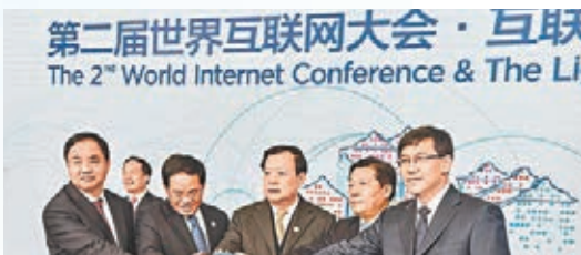
■國家互聯網信息辦公室主任魯煒(右三)、浙江省委書記夏寶龍(右二)、浙江省長李強(右四)等嘉賓參加世界互聯網大會主要內容之一的「互聯網之光」博覽會開幕式。

楨表示,經過20年發展,中國逐步從網絡大國走向網絡強國,探索出了具有中國特色的互聯網發展之路,形成了中國互聯網發展經驗,互聯網已成為國家經濟社會運行的重大公共基礎設施。報告顯示,中國的網絡零售交易額規模躍居全球