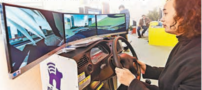
■博覽會參觀者在體驗汽車模擬駕駛裝置。

據了解,為期4天的「互聯網之光」博覽會,以展示中國互聯網的發展成就、中國對世界互聯網發展的積極貢獻和國際互聯網最新技術、產品和應用為主旨,精選了包括微軟、IBM、三星、阿里巴巴、騰訊、百度等258家全球大型互聯網企業和創新企業參展。