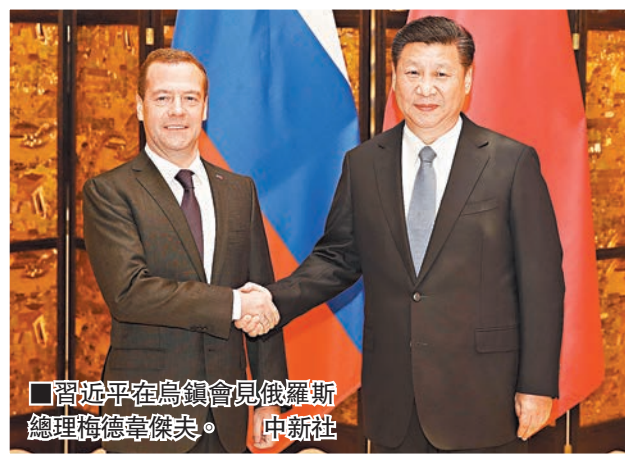
■習近平在烏鎮會見俄羅斯總理梅德韋傑夫。中新社

香港文匯報訊(記者俞晞浙江報道)第二屆世界互聯網大會今日在浙江烏鎮召開,本屆大會以「互聯互通·共享共治——構建網絡空間命運共同體」為主題,國家主席習近平將在開幕式上發表主旨演講。由中國網絡空間研究院昨日發佈的《中國互聯網20年發展報告(摘要)》(以下簡稱《報告》)顯示,據統計,截至2015年7月,中國網民數量達6.68億,網民規模全球第一,網站總數達413.7萬餘個,域名總數超過2,230萬個,「.CN」域名數量約1,225萬個,在全球國家頂級域名中排名第二,中國已經成為舉世矚目的網絡大國。