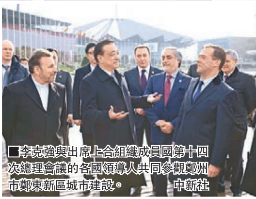
李克強與出席上合組織成員國第十四次總理會議的各國領導人共同參觀鄭州市鄭東新區城市建設。