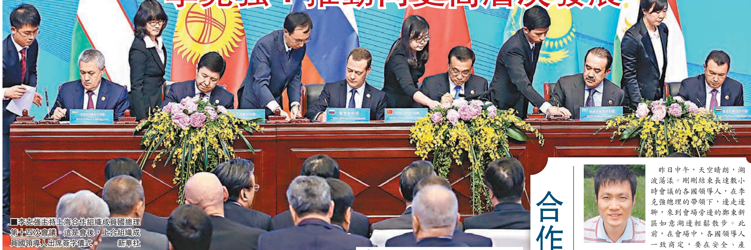
李克強主持上海合作組織成員國總理第十四次會議。這是會後，上合組織成員國領導人出席簽字儀式。

香港文匯報訊（記者 葛沖 鄭州報道）上海合作組織成員國總理第十四次會議昨日在河南鄭州舉行。中國國務院總理李克強主持會議並就深化成員國合作提出建議，倡導重點打造六大合作平台，推動合作向更高層次發展。在關於區域經濟合作聲明中，各方提出開展產能合作，在條件成熟的情況下於成員國建立產業園區或經濟合作區。