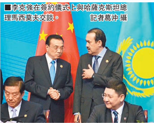
李克強在簽約儀式上與哈薩克斯坦總理馬西莫夫交談。