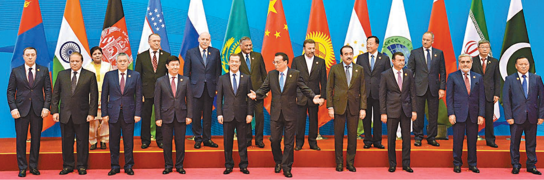
上合組織成員國政府首腦（總理）理事會第十四次會議昨日大範圍會談前集體合影。

阿卜杜拉表示，中國永遠是阿富汗可信賴的朋友和夥伴。中方發揮自身影響力，積極勸和促談，推進阿富汗和平進程，支持阿方和平重建，這有助於維護本地區和平穩定。阿中友好合作正不斷擴大和加深。中方在阿交通設施、能源、水電等領域投資符合阿富汗發展經濟、改善民生的需求，具有重大意義。阿方將盡全力保證和推進兩國合作項目順利開展。