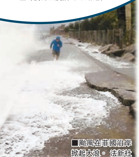
颱風在菲國沿岸掀起大浪。