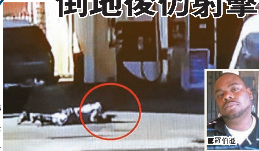
羅伯遜中槍後，倒在地上掙扎。