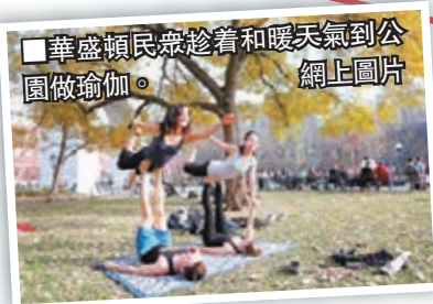
華盛頓民眾趁着和暖天氣到公園做瑜珈。