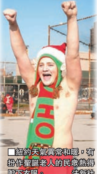
紐約天氣異常和暖，有扮作聖誕老人的民眾熱得脫下衣服。

這個冬天不太冷？聖誕節臨近，美國東岸多處天氣仍然和暖，紐約前日氣溫刷新百多年來同日最高紀錄，路人衣着單薄，華盛頓的櫻桃樹更不合時令地開花。氣象部門預測，美國東岸未來兩周氣溫仍會超出平均值，出現「白色聖誕」的機會不大。