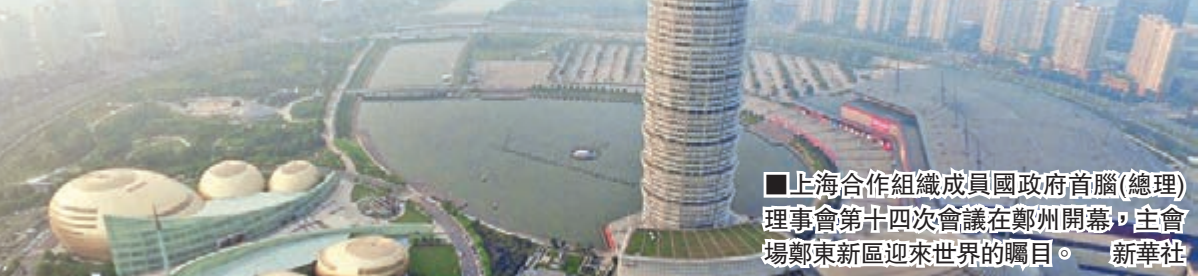
■上海合作組織成員國政府首腦(總理)理事會第十四次會議在鄭州開幕，主會場鄭東新區迎來世界的矚目。

成員國總理將發表關於區域經濟合作的聲明，重申各方積極支持實施絲綢之路經濟帶等區域合作倡議，推進絲綢之路經濟帶建設與各國發展戰略以及歐亞經濟聯盟等本地區一體化機制對接，以貿易便利化、產能合作、基礎設施建設、金融等領域合作為優先重點，推進區域合作邁向更深層次。