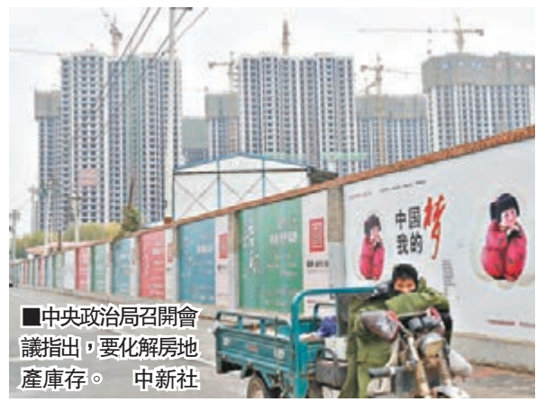
■中央政治局召開會議指出，要化解房地產庫存。

會議強調，城鎮化是現代化的必由之路。要堅持把「三農」工作作為全黨工作重中之重，同時要更加重視做好城市工作。要推進農民工市民化，加快提高戶