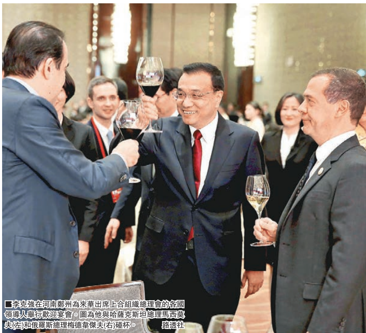
■李克強在河南鄭州為來華出席上合組織總理會各國領導人舉行歡迎宴會。圖為他與哈薩克斯坦總理馬西莫夫(左)和俄羅斯總理梅德韋傑夫(右)碰杯。

香港文匯報訊 綜合新華社、中新社報道：上海合作組織成員國政府首腦(總理)理事會第十四次會議12月14日至15日在河南鄭州舉行，中國國務院總理李克強主持會議。李克強昨晚為來華出席會議的各國領導人舉行歡迎宴會。本次會議將致力於提高成員國之間區域經濟合作水平，加快上合組織在安全保障和推動經濟發展兩方面實現「雙輪驅動」。