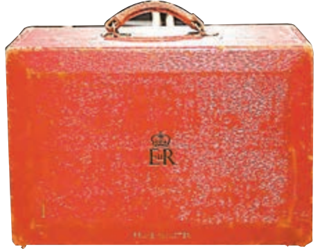
首相紅箱 估值：5,000英鎊