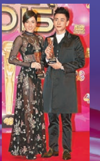
■黃宗澤與鍾嘉欣獲「2015年度內地最受歡迎TVB劇男、女藝人獎」。