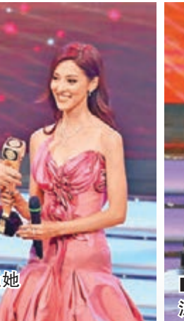
■《Sunday靚聲王》奪獎，林曉峰開心吻向汪明荃。