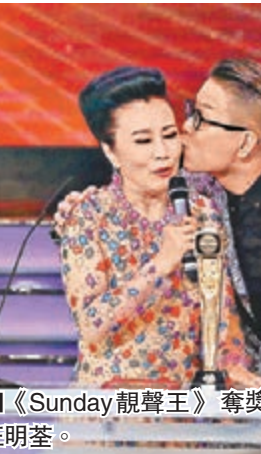
■洪永城在女友手上取得「飛躍進步男演員」獎。