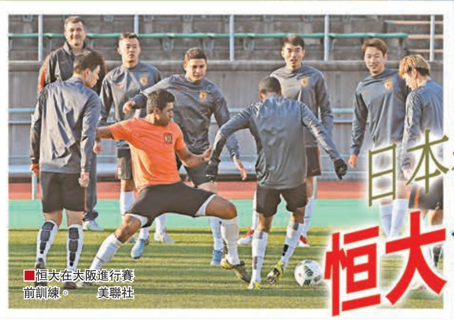
恒大在夫阪進行賽前訓練。