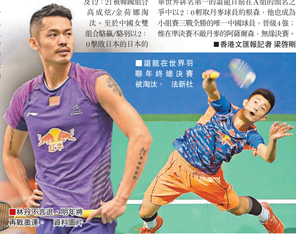
林丹不言退,明年將再戰奧運。資料圖片