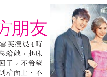
頒獎禮由炎亞綸與 Lulu 主持。

表示，郭雪芙凌晨4時傳微信訊息給她，起床有看到也回了，不希望私事被搬到檯面上，不喜歡炒新聞，且微信不會顯示訊息「已讀」，訝異媒體怎會知道是已讀不回，郭雪芙也沒說已讀不回，可能是媒體寫錯。問她是否替宋米秦感到委屈？李毓芬說，只要是姊妹都會，不僅是工作夥伴，私下還是好姊妹，當然會挺宋米秦。至於有沒有選邊站的感覺？她回應說其實沒選邊站，團體一直在同一邊，對事不對人。