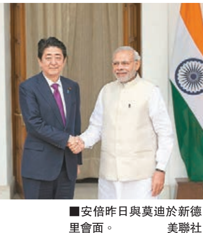
安倍昨日與莫迪於新德里會面。