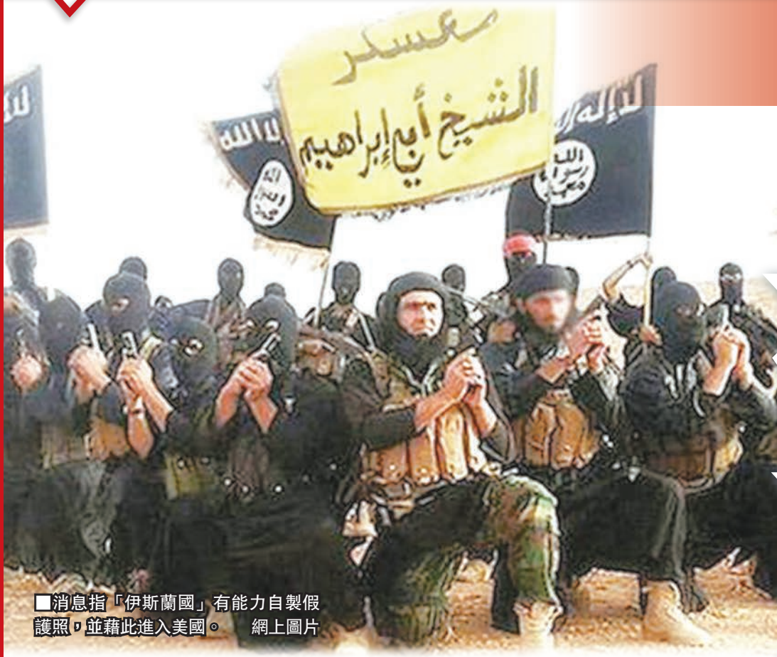
消息指「伊斯蘭國」有能力自製假護照，並藉此進入美國。