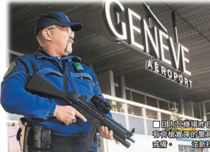
日內瓦機場昨日有荷槍實彈的警員戒備。