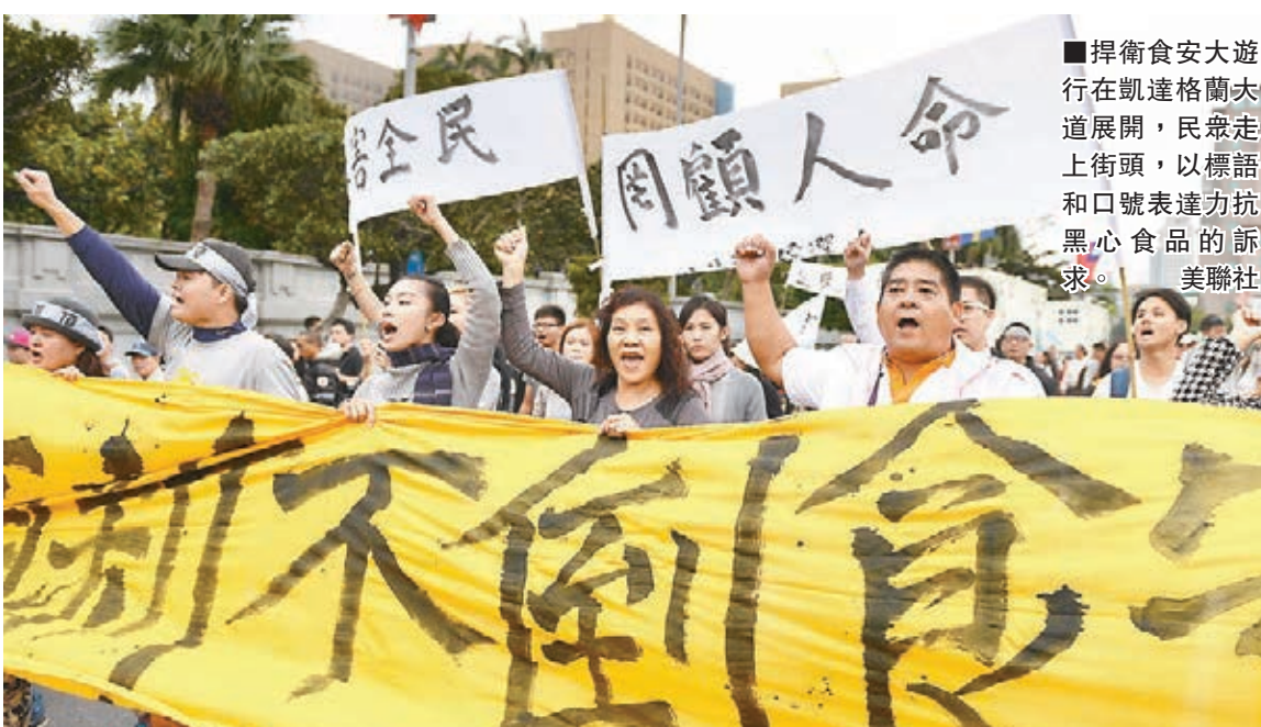
捍衛食安大遊行在凱達格蘭大道展開，民眾走上街頭，以標語和口號表達對抗黑心食品的訴求。

活動發起人強調，整場活動沒有政黨、財團介入，以零暴力、理性的態度來進行遊行抗爭，並希望台灣各政黨候選人不要帶競選旗幟、標語到場，然而現場仍可看到各競選團隊發文、舉旗幟的行為。