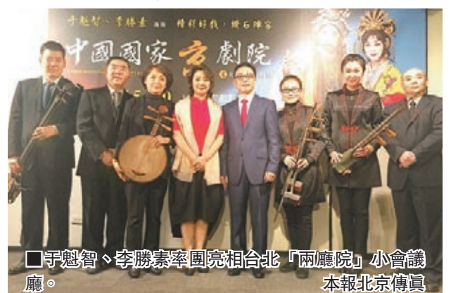
于魁智、李勝素率團亮相台北「兩廳院」小會議廳。

香港文匯報訊(記者 張紫晨、通訊員 宋洋)為增進兩岸文化認同，促進兩岸人文交流繼續作出貢獻，中國國家京劇院副院長兼藝術指導于魁智和一團團長兼領銜主演李勝素昨日下午率團亮相台北「兩廳院」小會議廳，出席中國國家京劇院第19次台灣演出新聞發佈會。在發佈會上，于魁智和李勝素介紹了中國國家京劇院一團23年來19次赴台灣交流演出的傳奇盛景及大陸京劇發展，特別是在青年觀眾推廣方面的顯著成就。他表示，大陸京劇在台灣特別受歡迎，明年6月第20次在台的演出目前已預約排滿。