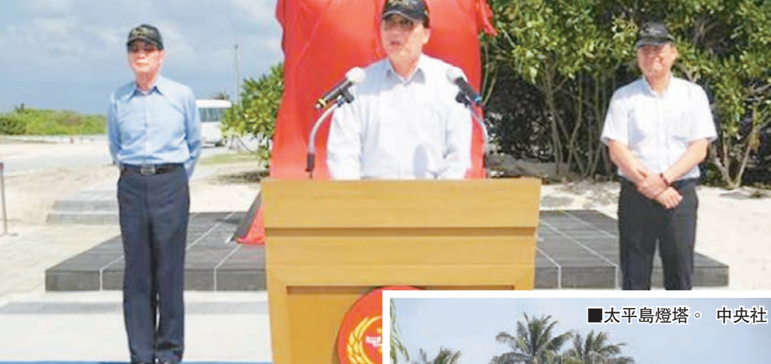
太平島燈塔。

太平島的消息，同時台灣「國安會」秘書長高華柱曾赴紐約與美國官員會面，雙方討論了南海主權爭議，會面結束後，馬英九就取消了太平島之行。