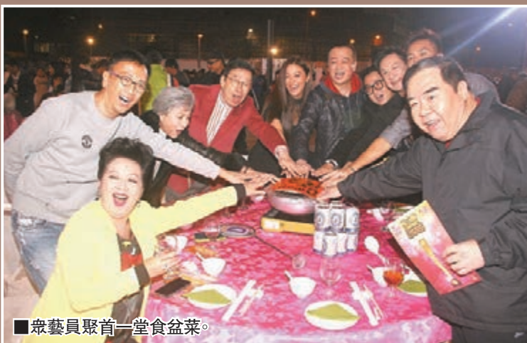
■眾藝員聚首一堂食盆菜。