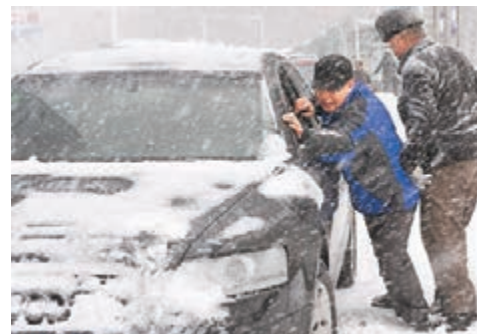
暴雪對烏魯木齊的城市交通造成嚴重影響。圖為市民正在雪中推車。新華社

香港文匯報訊 據新華社報道,新疆維吾爾自治區首府烏魯木齊拉響極端天氣紅色預警:從10日晚開始的降雪持續10餘小時毫無減弱的勢頭。11日清晨,烏魯木齊整座城市被大雪覆蓋。前一夜的積雪接近30厘米,可以埋沒人的小腿。