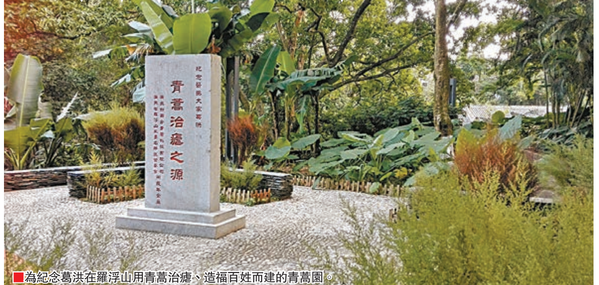
為紀念葛洪在羅浮山用青蒿治癒、造福百姓而建的青蒿園。

香港文匯報訊(記者余麗齡惠州報道)「青蒿一握,以水二升漬,絞取汁,盡服之。」12月7日下午,中國首位諾貝爾生理學或醫學獎得主屠呦呦在瑞典卡羅林斯卡醫學院發表題為「青蒿素的發現:中醫給世界的禮物」的演講。中國道教代表人物葛洪及其醫書《肘後備急方》也因屠呦呦走出國門,享譽諾貝爾獎的世界舞台。