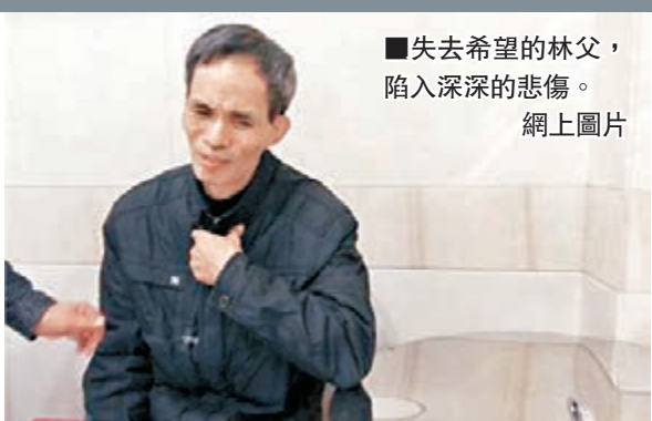
失去希望的林父,陷入深深的悲傷。

據新華社報道,最高人民法院審理該案的主審法官表示,經合議庭評議,依法作出了核准林森浩死刑的