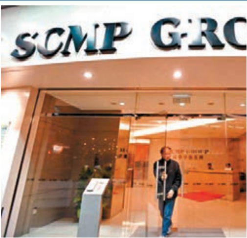
■ 是次收購包括《南早》及南早集團旗下的其他媒體資產。圖為南早集團報社。