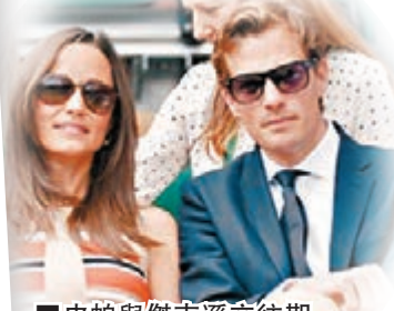
皮帕與傑克遜交往期間仍與哈里藕斷絲連。