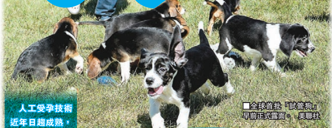
全球首批「試管狗」早前正式露面。