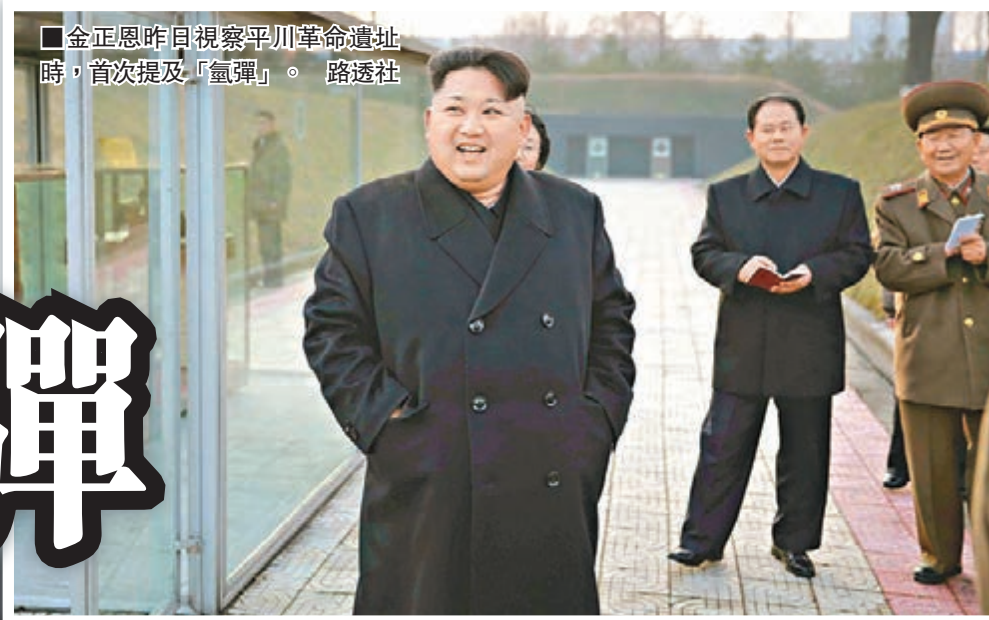
金正恩昨日視察平川革命遺址時，首次提及「氫彈」。