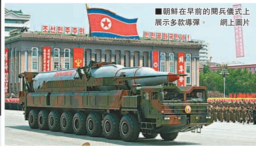
朝鮮在早前的閱兵儀式上展示多款導彈。網上圖片