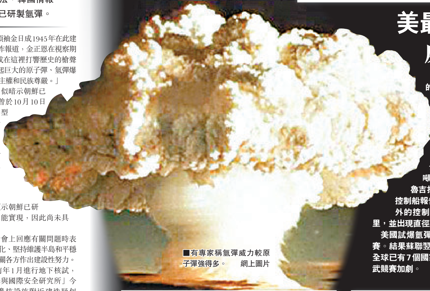
有專家稱氫彈威力較原子彈強得多。