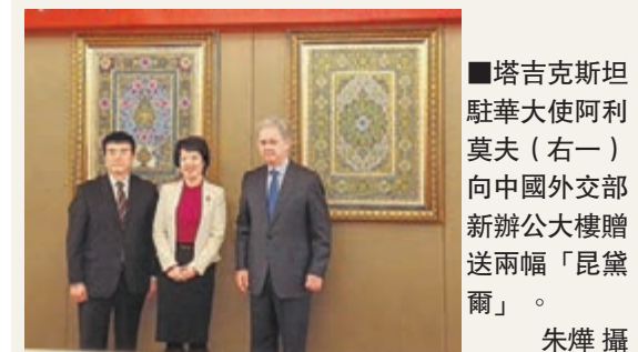
塔吉克斯坦駐華大使阿利莫夫(右一)向中國外交部新辦公大樓贈送兩幅「昆黛爾」。

香港文匯報訊(記者 朱燁 北京報道)塔吉克斯坦駐華大使阿利莫夫昨日將兩幅出自塔吉克藝術工匠之手的華美之作,贈與了中國外交部新落成的辦公大樓。