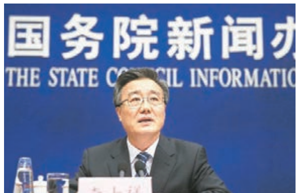
李士祥表示,通州區將嚴格做到職住平衡。

香港文匯報訊(記者 海巖 北京報道)北京市常務副市長李士祥昨日表示,2017年底北京市市屬行政事業單位部分或者全部搬到行政副中心,北京市委、市人大、市政府、市政協四大機構將帶頭疏解,而且在2017年底以前得以實現。據了解,行政副中心辦公區起步區將於今年年底開工建設。李士祥還表示,通州作為行政副中心,將嚴控房地產開發,嚴格做到職住平衡,不能出現新的大城市病。