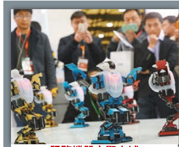
服務機器人聚申城

報告說,2030年至2050年期間,得益於早期持續投資的長期收益,中國氣候融資需求將快速下降,到2050年這一融資需求將降至1.5萬億元人民幣。氣候融資是指應對氣候變化的專項投資和相關投資的總和。據中央財經大學氣候與能源金融研究中心副主任劉倩介紹,目前內地公共資金仍在應對氣候變化方面發揮着不可替代的作用,無論是中央財政還是地方財政,近年來投向氣候變化領域的公共資金的絕對規模都大幅增加。