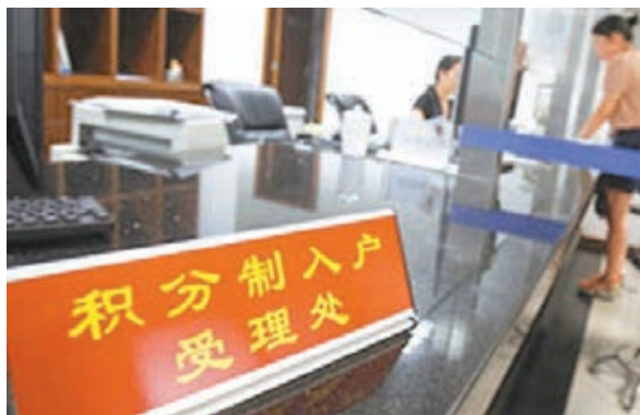
北京計劃實施積分落戶制度。 資料圖片

香港文匯報訊(記者 高麗丹 北京報道)傳聞已久的北京積分落戶政策日漸明朗。昨日下午,《北京市積分落戶管理辦法(徵求意見稿)》向社會公開徵求意見。