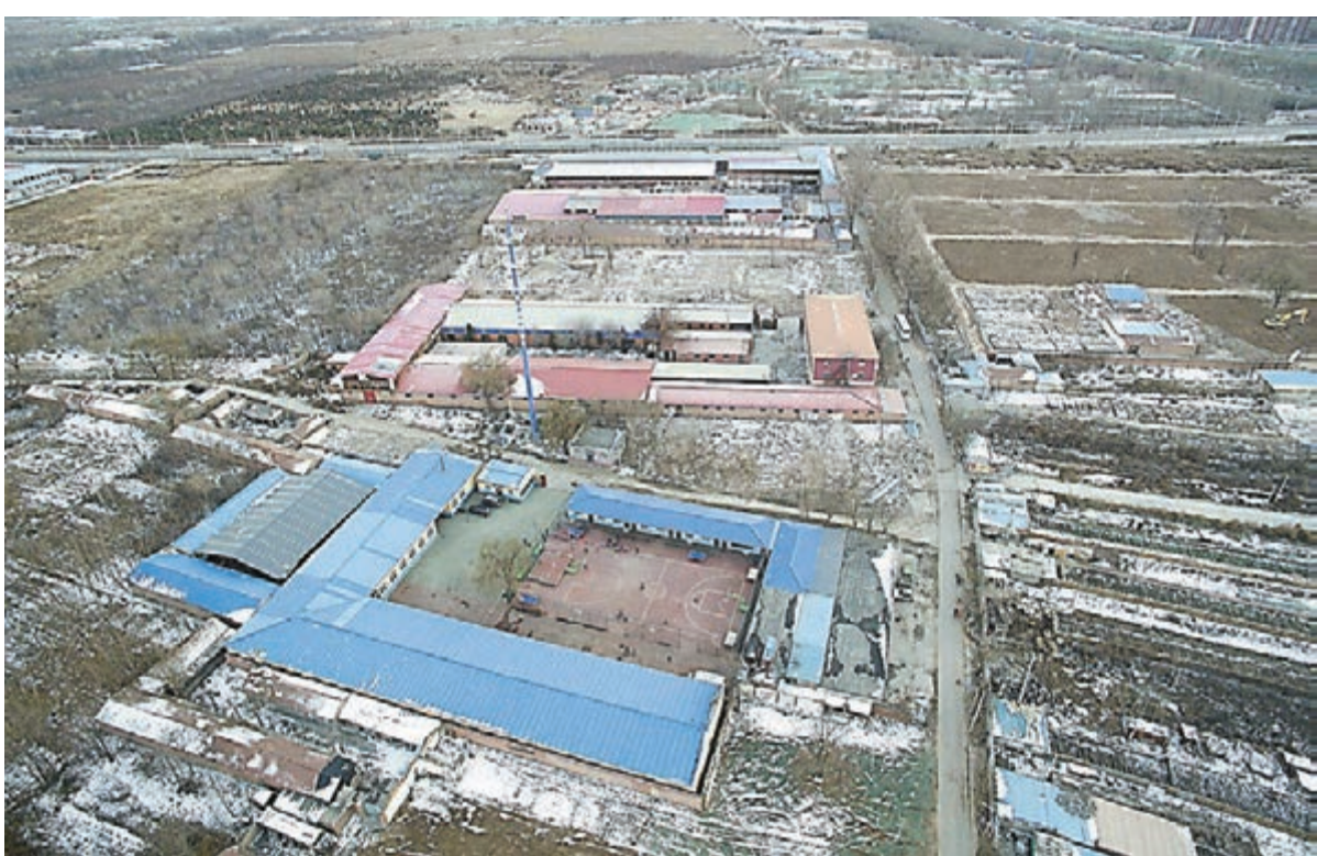
北京市行政副中心的行政辦公區所在地,位於六環外通州區潞城鎮郝家府村,這裡的拆遷工作已經完畢,核心區建設已全面展開。 中新社

辦公、文化旅遊、商務服務」,「功能也不能太多」,分為「生態環境用地、居住生活用地、產業發展用地」三類用地。