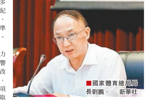
國家體育總局局長劉鵬。

距離第十三屆全國冬季運動會開幕還有一個多月，國家體育總局局長劉鵬昨日在冬運會賽風賽紀和反興奮劑工作會議上要求，從思想上、政治上、組織上和行動上為冬運會的成功舉辦做好各項準備，確保舉辦一屆風清氣正、圓滿成功的冬運會。他介紹冬運會為此進行了六項改革調整。 為更好地維護公平競爭的體育精神，防止權力尋租和利益輸送，增強冬運會發展動力和影響力，國家體育總局對冬運會進行了六個方面的改革調整：一是優化項目結構，突出奧運會項目，增加優勢項目青年組項目設置，調整後奧運會項目比例由上屆的62%提高到本屆的89%；二是取消了代表團成績排名方法；三是取消了冬奧會成績帶入全運會和冬運會政策；四是取消了冬運會成績帶入全運會政策；五是取消了解放軍兩次計分政策；六是取消了冰球加牌加分政策。