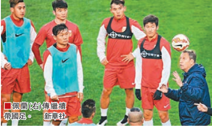
佩蘭(右)傳繼續帶國足。