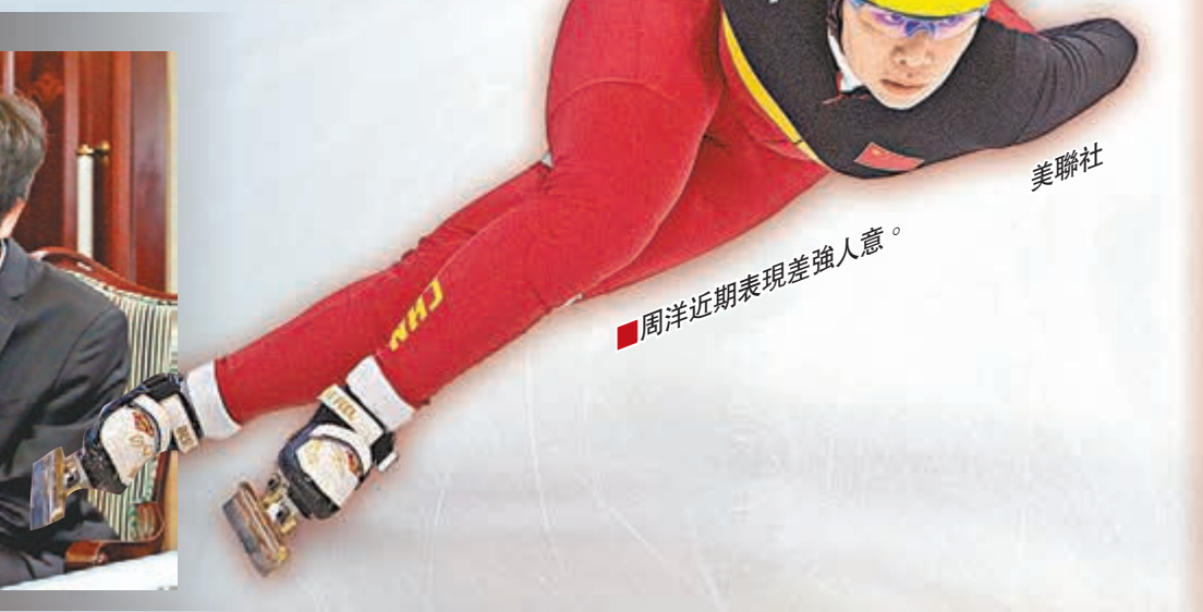
周洋近期表現差強人意。