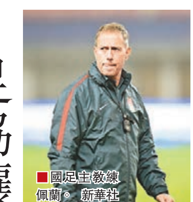
國足主教練佩蘭。 新華社

據內地媒體《北京青年報》昨日報道，隨着全國足代會臨近，中國足協從協會領導層到各職能部門都在為此次會議做籌備，有關國足主帥佩蘭去留問題的討論也暫時被擱置。據悉，由於目前國足在世界盃外圍賽40強賽競爭中，如最後兩輪連勝，仍有挺進12強賽的希望，因此從內容來說，佩蘭並沒有構成違約，中國足協也無意違約終止合同。此外，目前也無人願在此時接手國足替前任履責，因此足協目前基本確定繼續讓佩蘭帶隊打40強賽。 一位協會人士說：「中國足協和國足都可以接受來自各方的批評與建議，但這個時候球隊還沒有出局，當務之急是團結一切可以團結的力量，將最後兩輪比賽的備戰重視起來，要確保球隊能夠取得兩連勝。所以，妄自菲薄對這支球隊只能造成傷害。總是被負面傳聞包圍的主教練又怎樣凝聚球員的戰鬥力？」