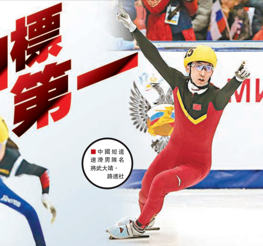
中國短道速滑男隊名將武大靖。