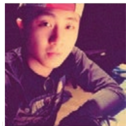
阿嘉曾聲演賣座動畫電影《玩轉腦朋友》。

說到未來夢想及發展,阿嘉像任何一位藝術工作者般,希望能有一套個人代表作,也很希望能開設自己的製作公司,可以有更大的自主創作空間,但他自知其經驗及網絡尚不足,現時會作更