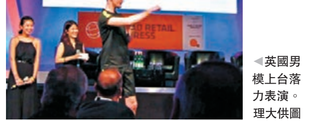
英國男模上台落力表演。