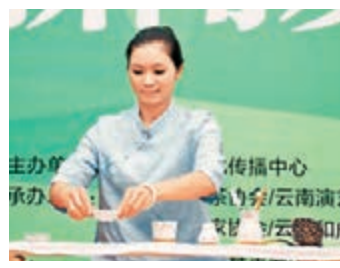
第十屆中國小姐大賽新聞發佈會現場舉行茶藝表演。