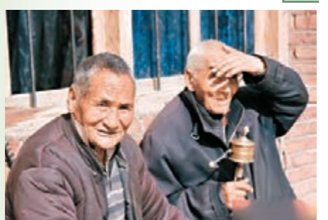
甘肅有個尼巴村，被當地人稱為長壽村。

甘肅首批「長壽村」日前命名，被評定的「長壽村」主要分佈在山清水秀的隴東南地區，這裡也是國家旅遊局、國家中醫藥管理局確定的全國中醫藥養生保健旅遊創新區，8個「長壽村」共有百歲老人13名，且80至89歲、90至99歲及100歲以上