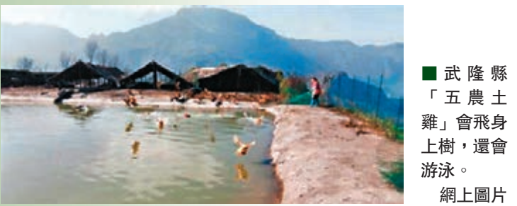
武隆縣「五農土雞」會飛身上樹，還會游泳。網上圖片