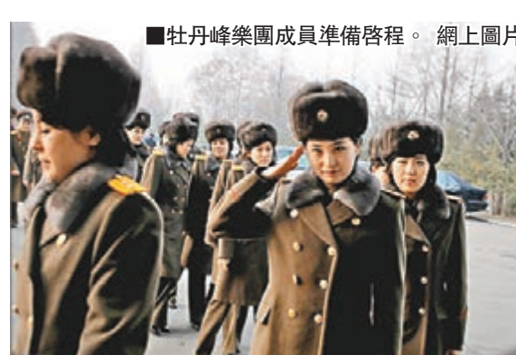
■牡丹峰樂團成員準備啟程。

中社此前報導說,朝鮮功勳國家合唱團和牡丹峰樂團將於10日至15日對中國進行友好訪問並舉行公演。