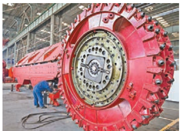
■11月內地工業生產者出廠價格(PPI)同比下降5.9%。圖為工人正在調試採煤機。

從同比來看,石油加工、黑色金屬冶煉和壓延加工、有色金屬冶煉和壓延加工、化學原料和化學製品製造出廠價格同比分別下降20.6%、19.9%、13.5%和7.9%,合計影響當月PPI總水平同比下降約3.3個百分點,佔總降幅的56%左右。