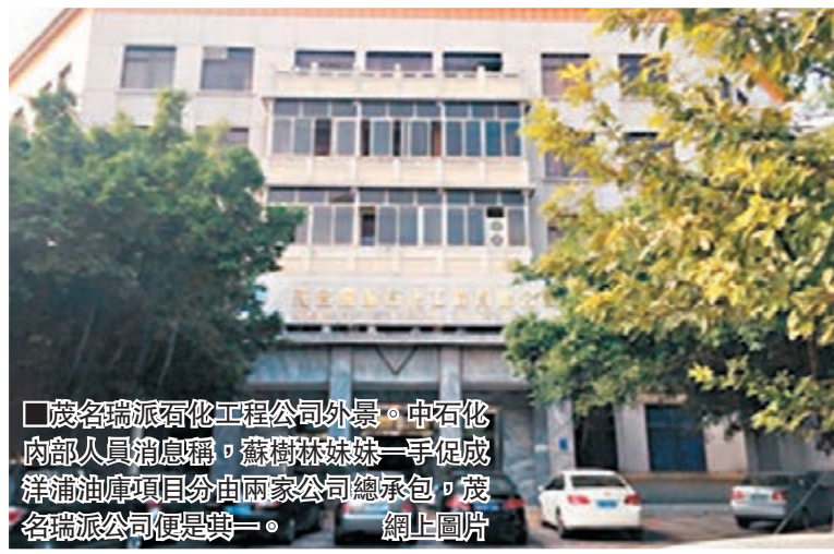
■慶名瑞派石化工程公司外景。中石化內部人員消息稱，蘇樹林妹妹一手促成洋浦油庫項目由兩家公司總承包，慶名瑞派公司便是其一。