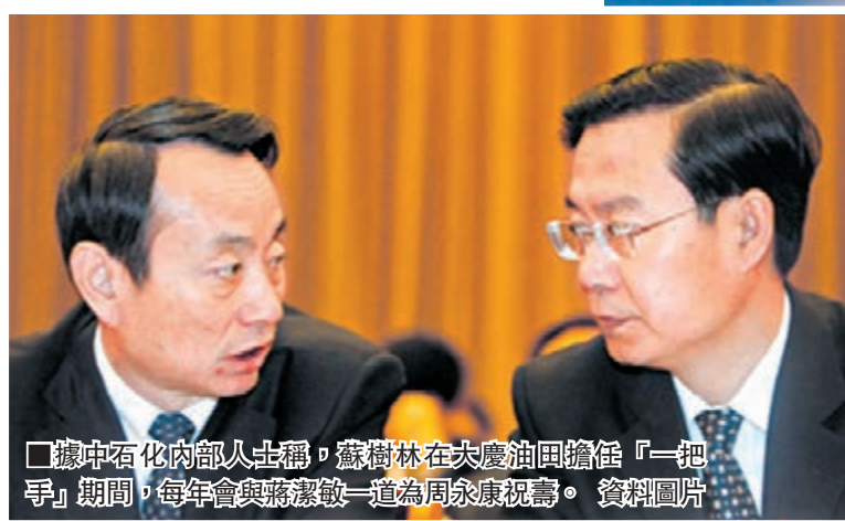
■據中石化內部人士稱，蘇樹林在大慶油田擔任「一把手」期間，每年會與蔣潔敏一道為周永康祝壽。資料圖片

香港文匯報訊 據《新京報》報道，曾任中石化集團公司「一把手」，「空降」為福建省省長的蘇樹林，在石油、石化系統塌場式腐敗面前，未能獨善其身。十八大後，蘇樹林的老同事蔣潔敏等人相繼落馬，從那時起，關於蘇樹林將會出事的傳言一直伴其左右。據中石化內部人士稱，蘇樹林在大慶油田擔任「一把手」時與周永康走得很近。每年周永康生日期間，蘇樹林會與蔣潔敏一道為周永康祝壽。但在中石油系統反腐時過兩年，周永康、蔣潔敏等人已接受審判，蘇樹林仍安然無事，表面看起來風平浪靜。直至去年底，中央巡視組專項巡視中石化，查出蘇樹林違法違紀的線索，蘇樹林被中紀委帶走調查，成為十八大後第一個「落馬」的在職省長。據中石化內部人員透露，中央巡視組獲得的蘇樹林違法違紀線索，主要集中在中石化安哥拉項目和海南洋浦油庫項目。