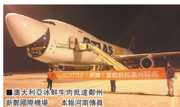
■澳大利亞冰鮮牛肉抵達鄭州新鄭國際機場。

今，共進口肉類產品12批、165噸，包括澳大利亞冰鮮牛肉和來自英國、西班牙的豬肉，包含了空陸聯運和海陸聯運模式。