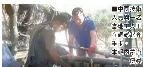
■中國技術人員與一名當地工人正在調試北奔重卡。

據寧夏機場公司相關負責人介紹，城市候機樓功能為一個小型綜合體，通過新的乘機模式，減少旅客時間成本、交通成本，並通過位置優勢，打破人們觀念中坐飛機過程複雜的印象，從而拉動飛機客流量。