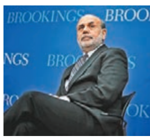
伯南克將擔任論壇專題午餐會的主講嘉賓。

今屆論壇的一個重點，當然不少得「一帶一路」。「一帶一路」為改變世界經濟格局的重要策略，通過加強基建、金融、貿易和社會的合作，帶來龐大和多元化的投資機會，令區域以至全球各國達至互利共