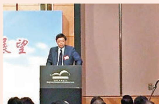
港交所首席中國經濟學家巴曙松於中國經濟形勢論壇演講。

香港文匯報訊(記者 張易)中國僑聯與香港僑界社團聯合會主辦的「中國經濟形勢與前景展望」昨日舉行，港交所(0388)首席中國經濟學家巴曙松預計，內地經濟明年將呈現「宏觀趨穩、微觀分化」，香港憑借資訊、人才和產業優勢，相信可在新形勢下作出獨特判斷，成為「十三五」增長動力。