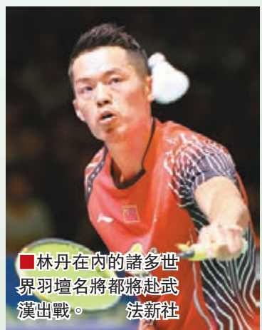
■ 林丹在內的諸多世界羽壇名將將赴武漢出戰。

昨日從武漢體育中心獲悉，2016年亞洲羽毛球錦標賽將於4月26日至5月1日在武漢舉行，這也是武漢連續第二年舉辦該賽事。據悉，包括林丹、李宗偉、諶龍、李龍大、內瓦爾、李雪芮在內的諸多世界羽壇名將都將赴武漢出戰。2016年亞錦賽也將成為羽毛球選手爭奪里約奧運會入場券的最後關鍵一站。