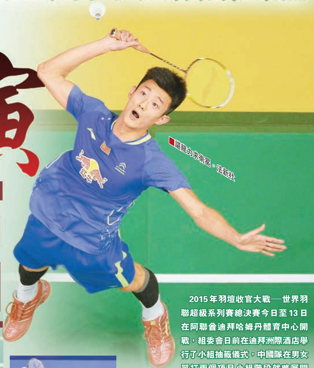
■ 諶龍力求完美。

2015年羽壇收官大戰——世界羽聯超級系列賽總決賽今日至13日在阿聯會迪拜哈姆丹體育中心開戰，組委會日前在迪拜洲際酒店舉行了小組抽籤儀式，中國隊在男女單打兩個項目小組階段就將展開「打吡之爭」，而參加雙打項目的六對中國組合則各自分到了不同小組，避免了過早「內戰」。