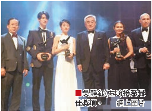
■ 吳靜鈺(左三)接受最佳獎項。

2015WTF世界跆拳道聯合會年度頒獎盛典昨日在墨西哥城舉行，中國奧運冠軍吳靜鈺榮膺年度最佳女子運動員。早前，世界跆拳道年度總決賽在墨西哥城落幕，奧運冠軍吳靜鈺勇奪女子49公斤以下級冠軍，時隔三年重回世界第一。這也是中國選手首次在該項賽事奪冠。吳靜鈺實現了奧運會、年度總決賽、世錦賽和大運會的跆拳道世界大賽個人項目全滿貫。 ■ 記者 梁啟剛