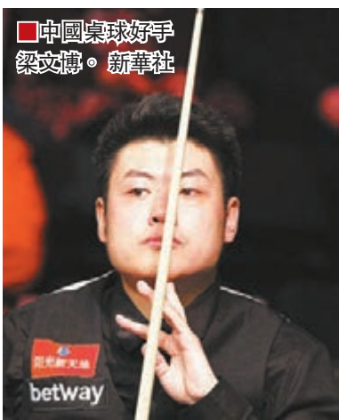
■ 中國桌球好手梁文博。