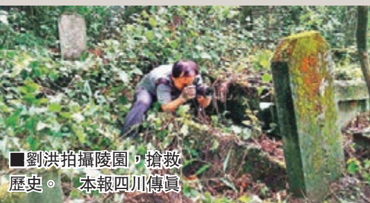
■劉洪拍攝陵園，搶救歷史。本報四川傳真

「這位戰士姓徐，被一塊掉下來的大石頭壓住半截身子。」塌方還在繼續，一批戰友圍在徐戰士身邊，用雙手拚命挖着，血水從十指尖滲出。此時的徐戰士努力喊道：「我們修成昆鐵路毛主席知道嗎？」在場的救援人員全愣住了，緊接着就有人帶着哭腔回答道：「知道！不僅知道，主席還說成昆鐵路修不通他睡不着覺！」隨後眾人沉默，只見石塊愈發快速墜落，徐戰士抓起一塊石就砸在自己頭上。「咚」的一聲，腦袋就歪一邊兒去了，額頭上鮮血一股一股地往外冒……」徐戰士留下的最後一句話是，「你們快出去，活着，把路修通」。戰友們撤出後不久，整個隧道就全塌了，而徐戰士的遺體也被掩埋於此。