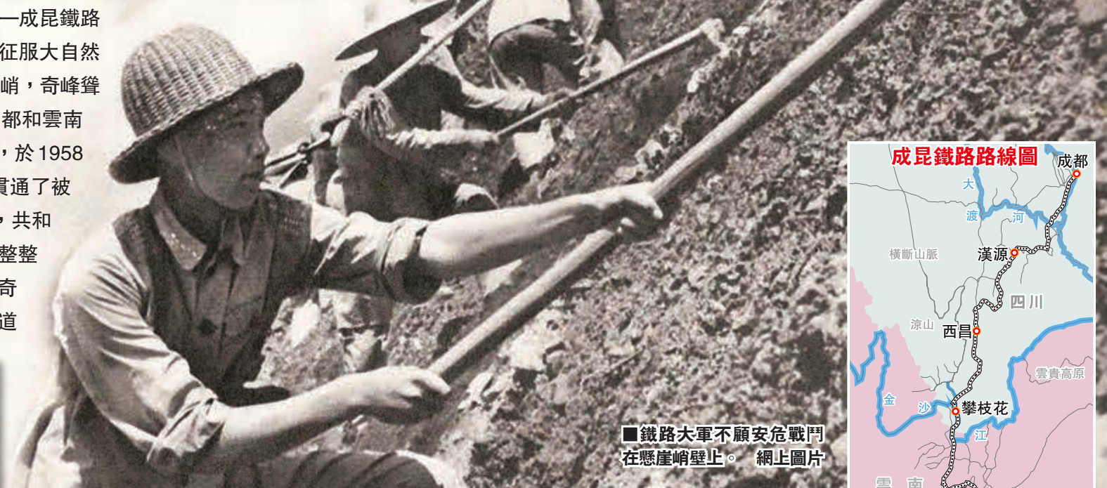
■鐵路大軍不顧安危戰鬥在懸崖峭壁上。