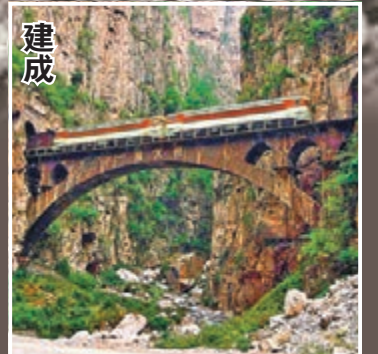
■一線天橋跨越四川大渡河畔老昌溝深谷，主拱跨度54米，是中國跨度最大的空腹式鐵路石拱橋。本報四川傳真