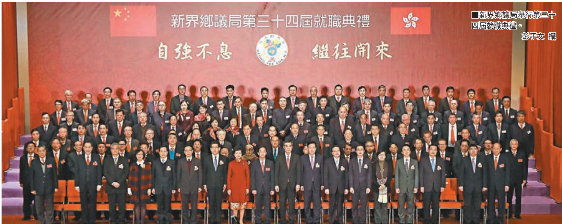
■新界鄉議局舉行第三十四屆就職典禮。

劉業強指，該局堅持履行應有盡有的義務與責任，為的是新界鄉民、族群的福祉，鄉議局會一如既往堅決維