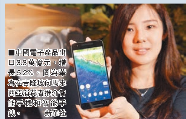
中國電子產品出口3.3萬億元，增長5.2%。圖為華為在吉隆坡向馬來西亞消費者推介智能手機和智能手錶。