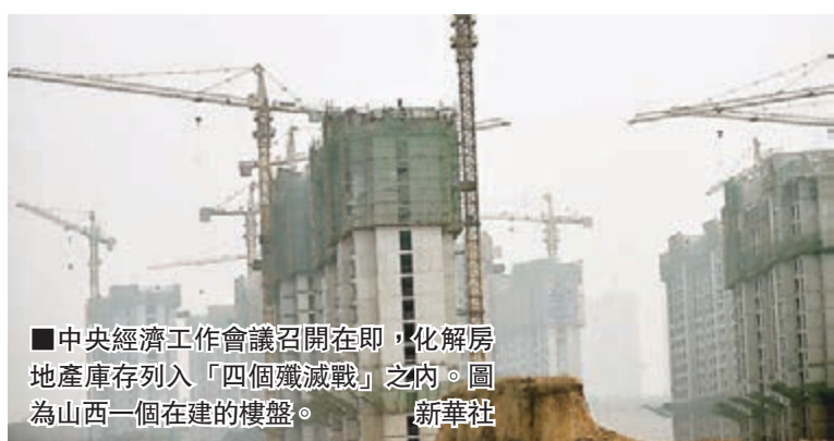
中央經濟工作會議召開在即，化解房地產庫存列入「四個殲滅戰」之內。圖為山西一個在建的樓盤。

值得注意的是，同為國家重要戰略性政策的保障房及棚戶區改造有望與樓市去庫存深度銜接。在今年的政府工作報告中，李克強曾明確提出「把一些存量房轉為公租房和安置房」。在保障房和商品房之間打通一條軌道，是一個「一石多鳥」的創新型調控思路。一方面，房地產有去庫存需要，而2015年740萬套的保障房目標，又是政府民生工程的一大亮點，二者一拍即合；另一方面，明年是「十三五」的開局之年，實現好房地產的轉型升級，解決老百姓的住房需求，是全面小康的要求。